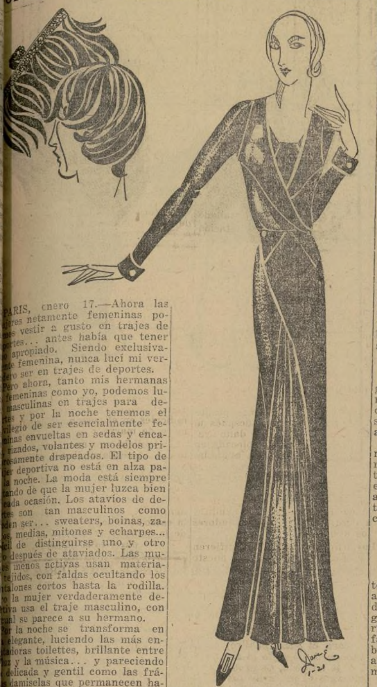
Lindo modelo en crepe negro, adornado con armiño

chic en traje de noche, ni aun elegante... sino que parece estar en el hogar, en el momento de salir a la calle. En el estilo imperio, con la doble cintura de la época, el corsé y la manera de saber lucir airoso a la figura, las que hacen que la mujer pueda triunfar. Era muy original... el vestido hasta el tobillo, creación de Lenoir, en crepe de China negro... que les da el efecto de una línea recta. El pequeño lazo de armiño... de líneas graciosas, muy apropiado para el domingo por la noche o para una reunión formal por la tarde o en la casa por la noche. Lucía francamente exquisito.