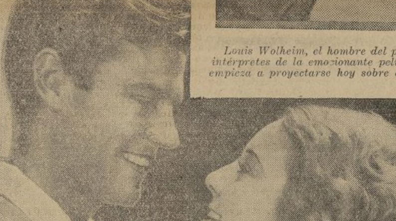
Jarl Me Crea y Dorothy Mackaill en una escena de "Once a Sinner", la cinta que se encuentra al presente en el teatro "Roxy".