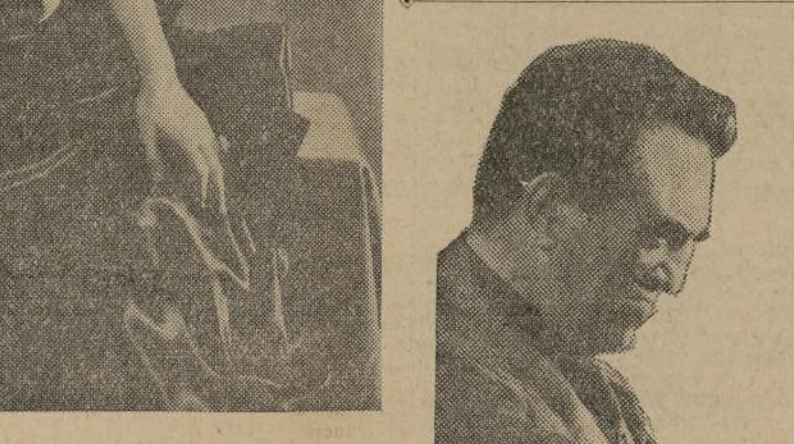
Louis Wolheim, el hombre del perfil darwiniano, y Jean Arthur interpretando la emocionante película hablada "Danger Lights", que empiezan a proyectarse hoy sobre el lienzo del "Regent".

La mayoría de los nueve restantes sufren de fractura del cráneo o de las extremidades.