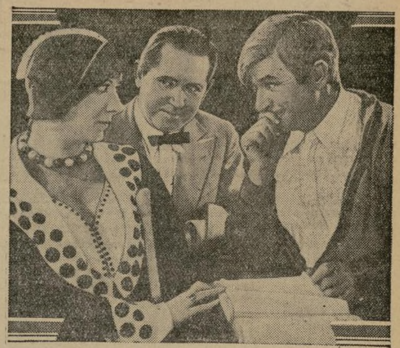
Will Rogers en uno de sus momentos característicos en la cinta "Lightnin", que se encuentra en el "Mt. Morris".

Gravemente heridos al caerse de un andamio BAYONNE, N. J., enero 20. (A.P.)— Dos obreros que estaban trabajando en un tanque de 30 pies de altura, de Best Foods Inc., resultaron gravemente heridos hoy, al caer de un andamio. Avisada la ambulancia fueron asistidos de primera intención.