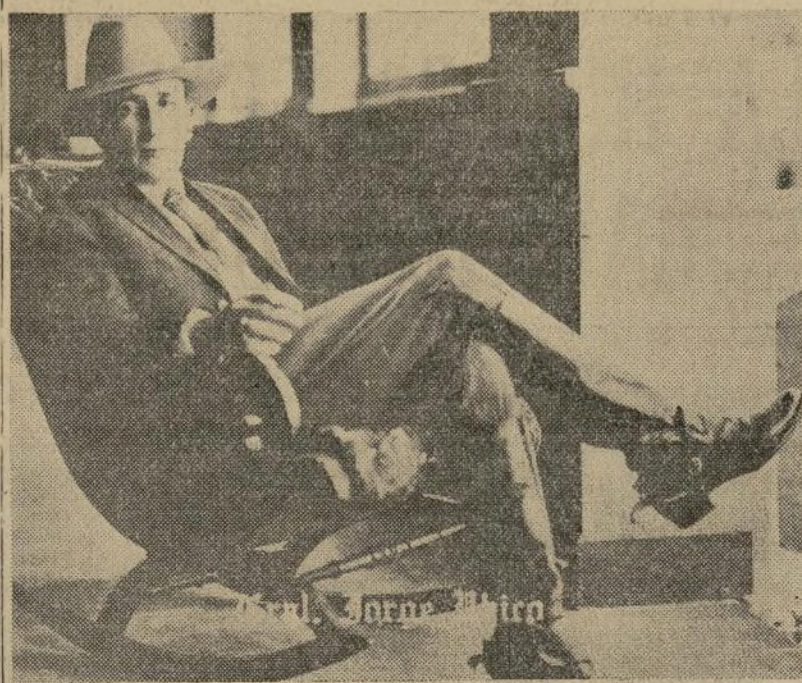
General Jorge Ubico, miembro de una acaudalada familia guatemalteca y figura prominente del ejército por muchos años a quien se considera muy probable vencedor de las elecciones presidenciales que se celebrarán a principios del mes entrante.