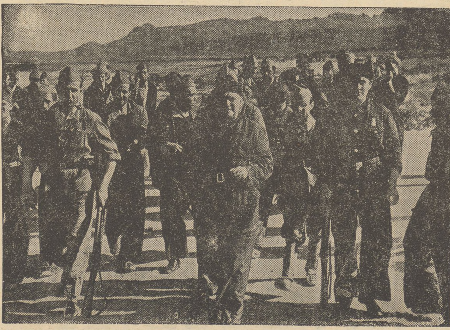
El líder socialista, Largo Caballero, visita constantment les línies de combat encoratjant els milicians. L'entusiasme combatiu del vell diputat dona optimisme als lluitadors, i la seva tasca organitzadora assegura que no ha de mancar res a les línies de combat