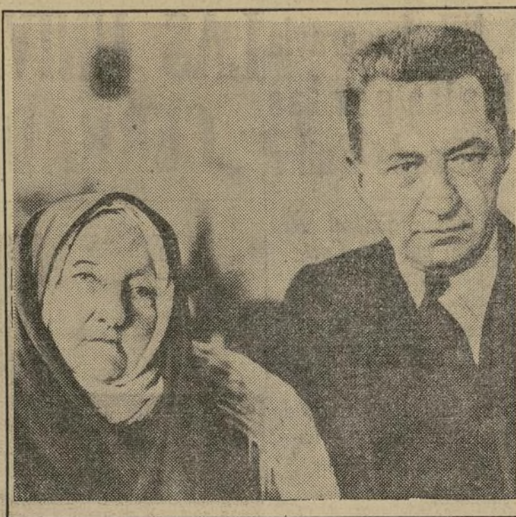
Alejandro Fedorovic Kerenski, primer presidente de la república rusa al caer el gobierno zarista en 1917, salvando en la ciudad de Praga a la señora Katerina Brekova, que tiene 87 años de edad y que es considerada como la madre de la revolución moscovita.

Señala el hecho de que el siglo XIX se distingue por los milagros realizados, entendiéndose por tales los milagros de la ciencia, cosa que no lo pueden ser de cualquier manera, —dice— Dios no se ha acretado de buen comerciante, pues si lo fuera habría más cristianos. La ética que resulta de todo esto, será una ética más pura, aproximándose el día en que tengamos un concepto más completo de estas complicadas cuestiones. Terminó su interesantísima conferencia manifestando que al fin y al cabo no estamos en el mundo para resolver