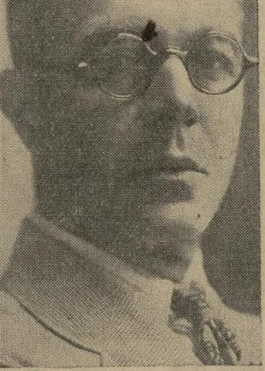
El senador Rafael Martínez Nadal, quien ha presentado su renuncia con carácter irrevocable a la presidencia del partido republicano puro de Puerto Rico. Explica que su actitud es motivada por la necesidad de proteger su hacienda, por encontrarse enfermo y debido a las dificultades que dentro de la colectividad se le presentan.

Se encuentra enfermo "Además de estas razones, tengo necesidad de reposo, por motivos de salud y por consejo del médico. Aunque en apariencia saludable, estoy sufriendo un desgaste del sistema nervioso que me ha traído serios trastornos en mi salud, y para corregirlos se me ha aconsejado descansar, y sobre todo, tranquilidad mental." "Entra también en los fundamentos de esta resolución mía el hecho de que no es bueno ni conveniente que se confunda en la misma persona la presidencia del partido y representación más o menos influyente en el Senado o