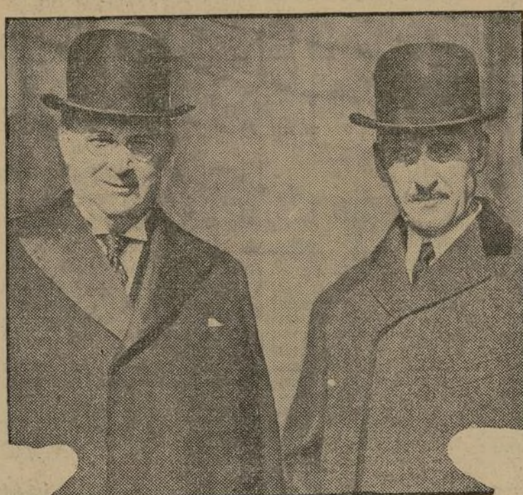
El primer ministro del Canadá, Mr. Richard B. Bennett, saludado por el secretario de Estado, Mr. Stimson, a su reciente llegada a Washington, en donde se cree que discutirá con Mr. Hoover la cuestión de límites en el río San Lorenzo.

ESTADISTA CANADIENSE VISITA ESTADOS UNIDOS