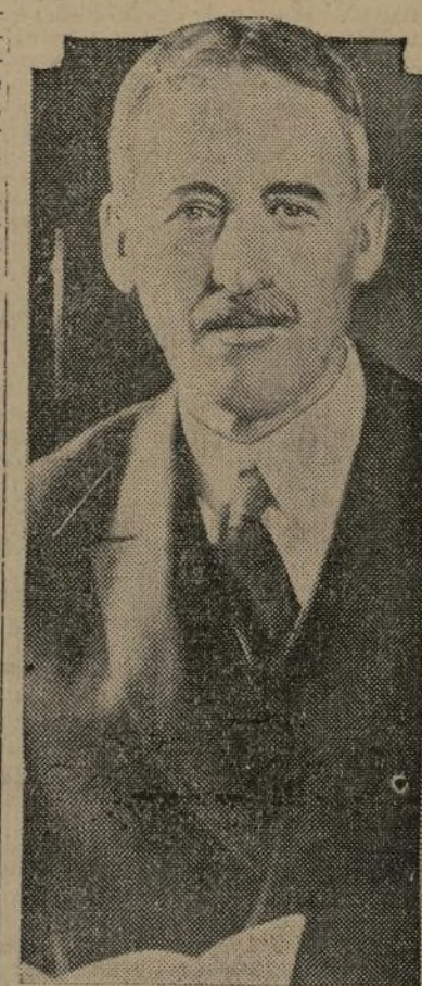
Secretario de Estado Henry L. Stimson

Respuesta al gobierno. LISBOA, febrero 6. (A).—Responde (Sigue en la 2a. pág.)