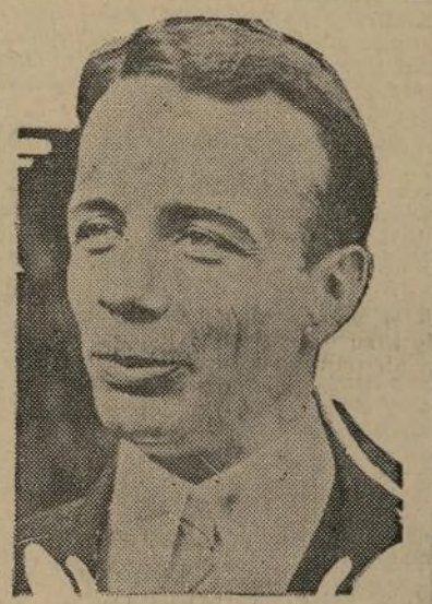
Gobernador Theodore Roosevelt