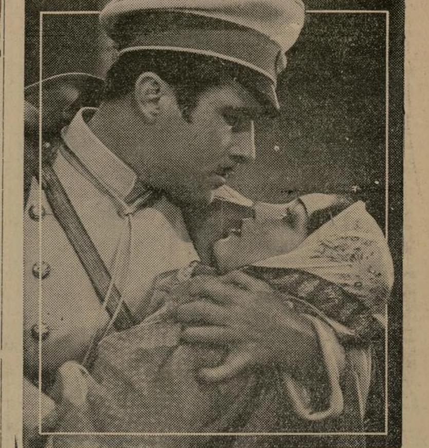
John Boles y Lupe Vélez, intérpretes de "Resurrection", que empieza a exhibirse hoy simultáneamente en el "Regent" y el "Hamilton".