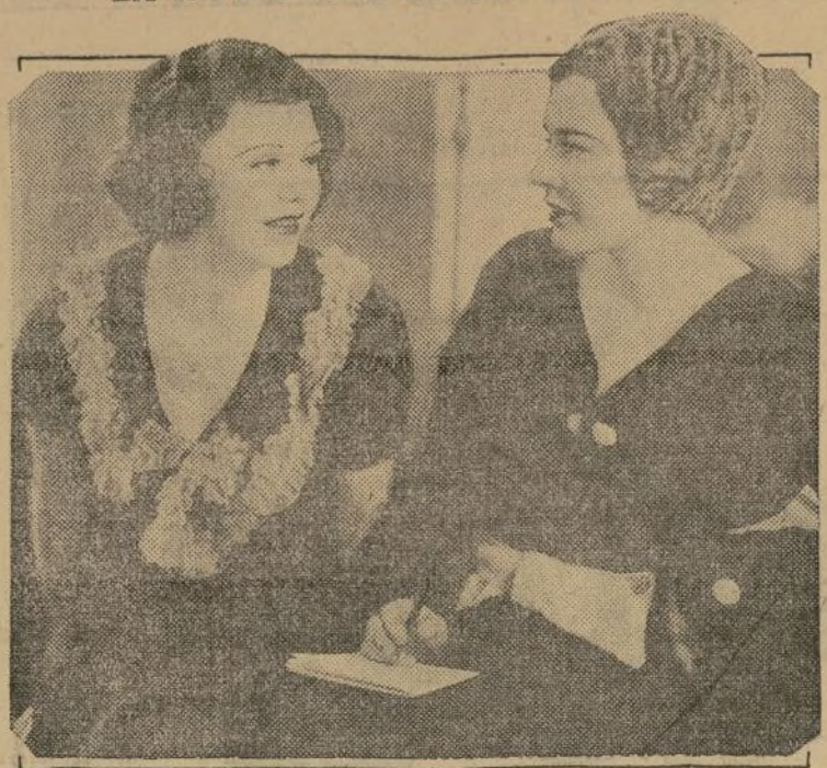
Lorna Fantin, la afamada numerologista, analiza la influencia de los números en el éxito alcanzado por Ginger Rogers (querida) en cinematografía, al dar cuenta por la WABC hoy a las 8.15 p. m. del resultado de su entrevista celebrada recientemente con la notable actriz de "Girl Crazy".