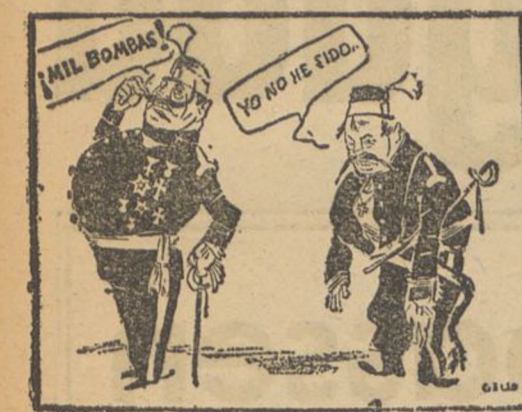
LA MORAL DE LOS GENERALES FACIOSOS VICTORIOSO VENCIDO

PREUS DE SUBSCRIPCIÓ: Barcelona, un any 1050 ptes. Fora, un trimestre 1050 ptes.