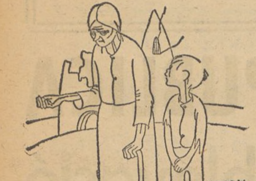
ERAN MUY RICOS, ABUELA? MUCHO, COMO LAS HERMANITAS DE LOS POBRES