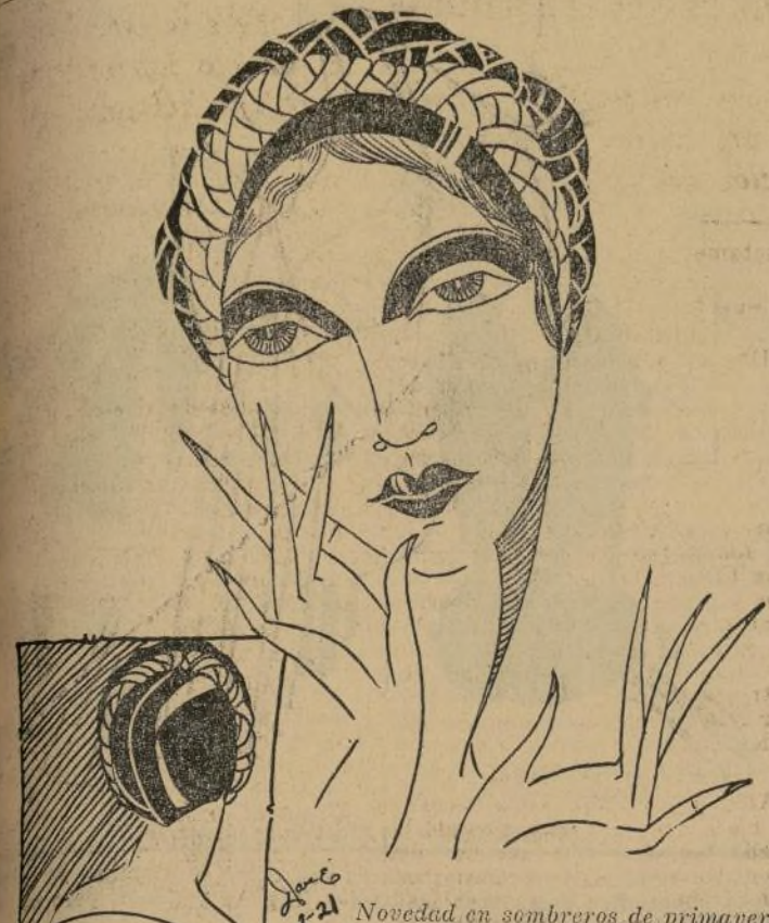
co equivocado. No dudo de la ele-