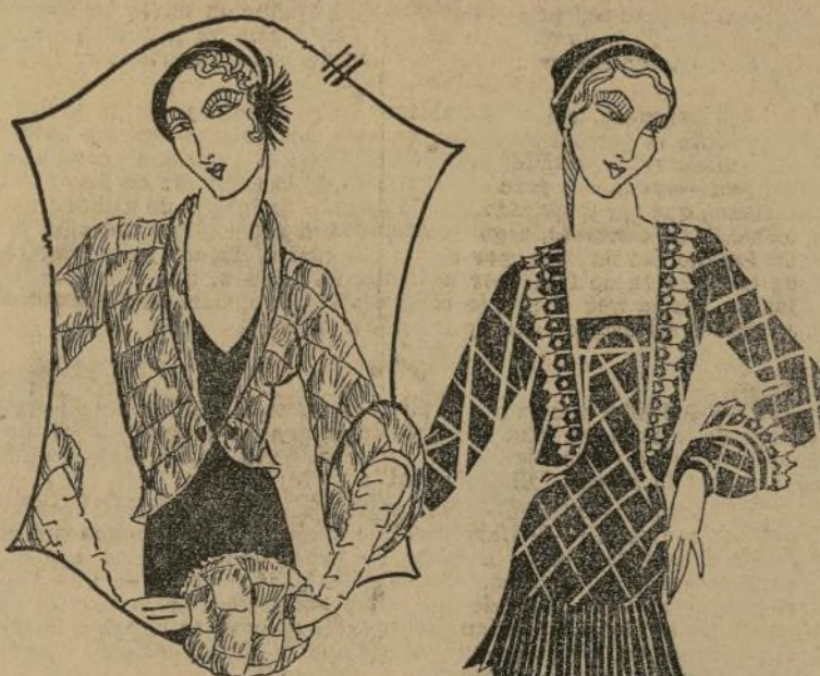
Crepe de chine con plisados en blanco y negro y pequeños toques del mismo color como adorno.

Se me olvidaba decirles que en la esquina les he diseñado mi cha-