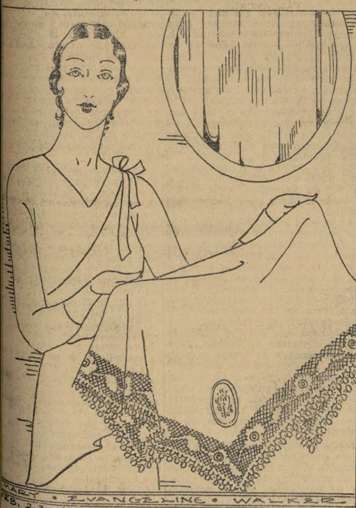
Las iniciales o monogramas de ben colocarse en una esquina.

Bordada y sencilla o más letras o monogramas en ella muchas ocasiones los manteles de encaje o bordados y colocados sobre la mesa están tan adornados, la tela sobre el borde en cada esquina se sabe si deben o no ponerlos. Cuando se marca en una esquina.