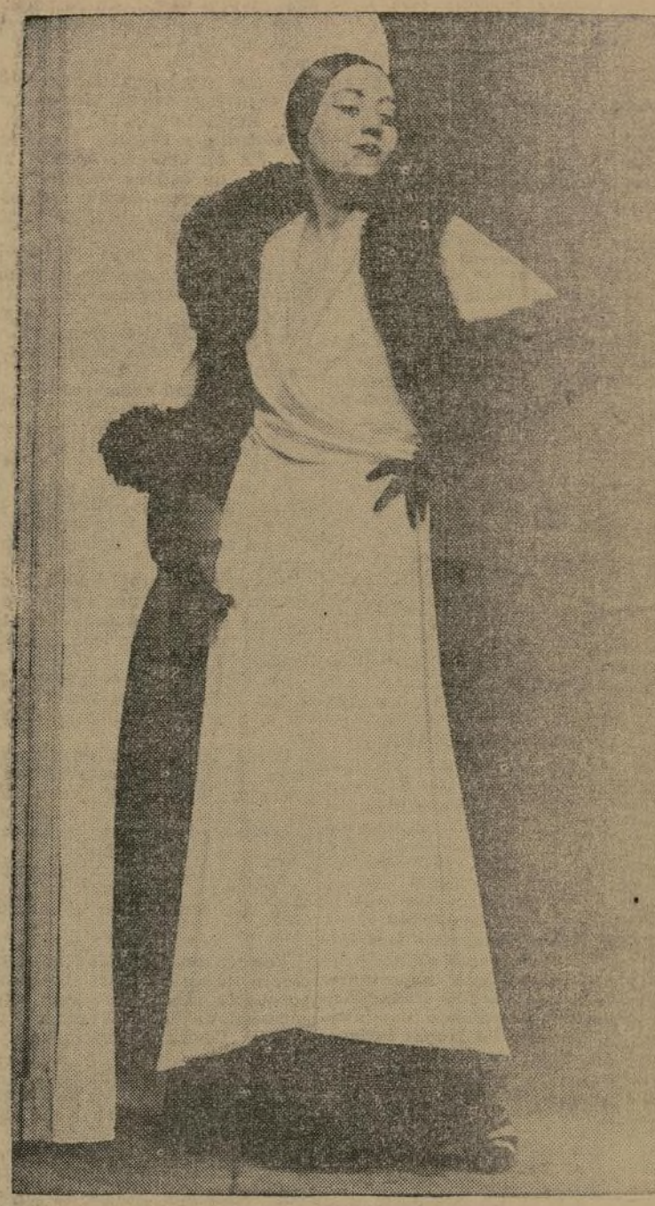
Daré, con elegante capa de noche, para verano. La capa es de crepe rasado, adornada con zorro plateado y cuello de esclavina. Modelo de Maggy Rouff, París.