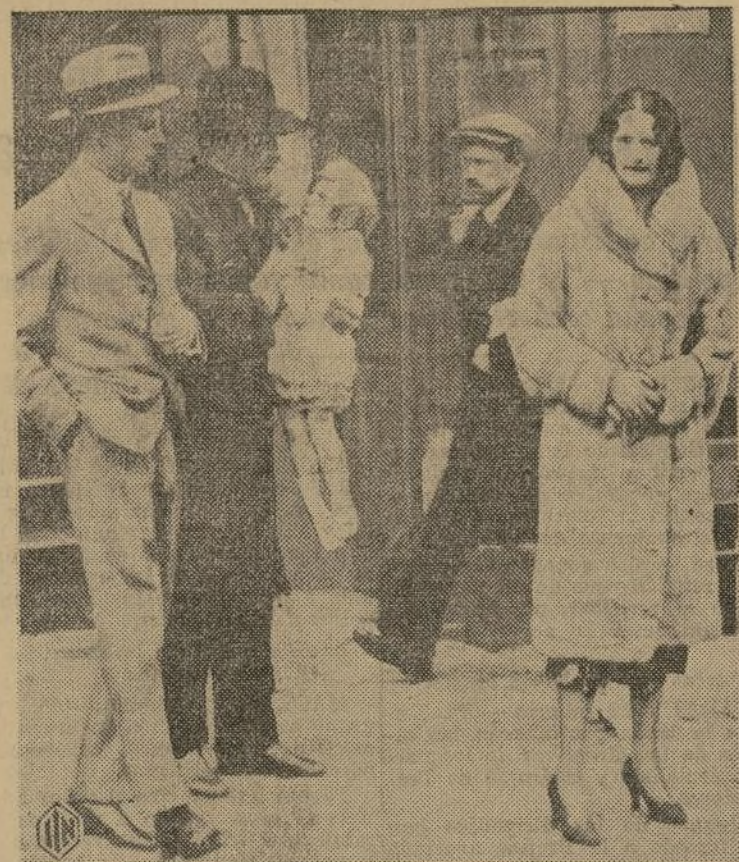
Con una sencillez máxima pueden ver nuestros lectores cómo el príncipe heredero de Bélgica Leopoldo (izquierda) y su esposa la princesa Astrid salen de un estudio fotográfico en Bruselas después de fotografiar a su hija, la princesa Josefina, de 3 años de edad, que aparece en brazos de un ayudante que acompaña a los príncipes.