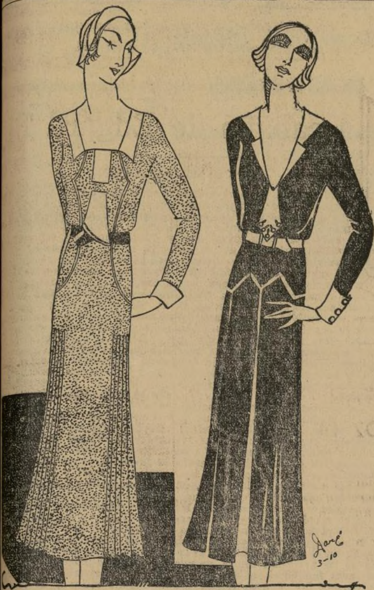
Los encantadores vestidos en lava liviana y sarga, con pequeños toques de piqué blanco.

Por Mlle. DARE EL BAILE DE TRAJES DE MAS- CARAS