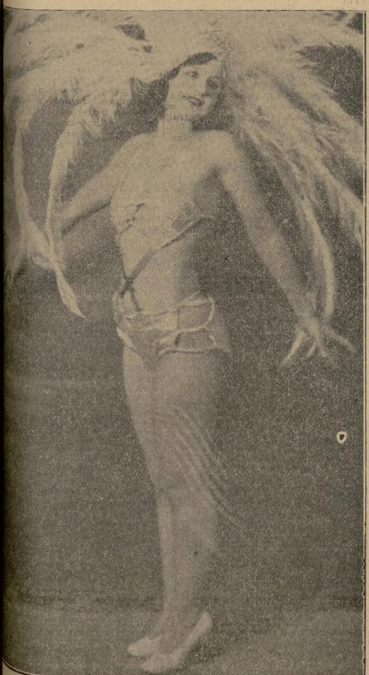
Una de las lindas muchachas del elenco de la revista "Kitty from Krepel", que se representa esta semana en el "Apollo Burlesque".

En la ocasión en que el popular director alemán a la capital prusiana a dirigir la primera película hablada de Emil Jannings "The Blue Angel". A consecuencia del triunfo logrado por Marlene en dicha cinta, fue contratada por la Paramount, para una producción no menos digna de que se camine un par de millas por la vida: "Abraham Lincoln", basada en la vida del inolvidable campeón de la libertad y protector del oprimido. Walter Huston, el hombre que se ha hecho famoso representando a los nobles de los personajes de la historia de este país, hace una caracterización soberbia en esta película. Una Merkel y Jason Robards secundan la labor de Huston no menos admirablemente. "It Pays to Advertise", con Norman Foster, "Sketches", Gallagher, Carol Lombard y Eugene Palette complementan el programa. Teatro Gaiety Hoy, para permanecer hasta el sábado, se empieza a exhibir en este teatro la interesantísima película toda hablada en español "Oriente y Occidente", cuyos papeles principales están a cargo de Lupe Vélez.