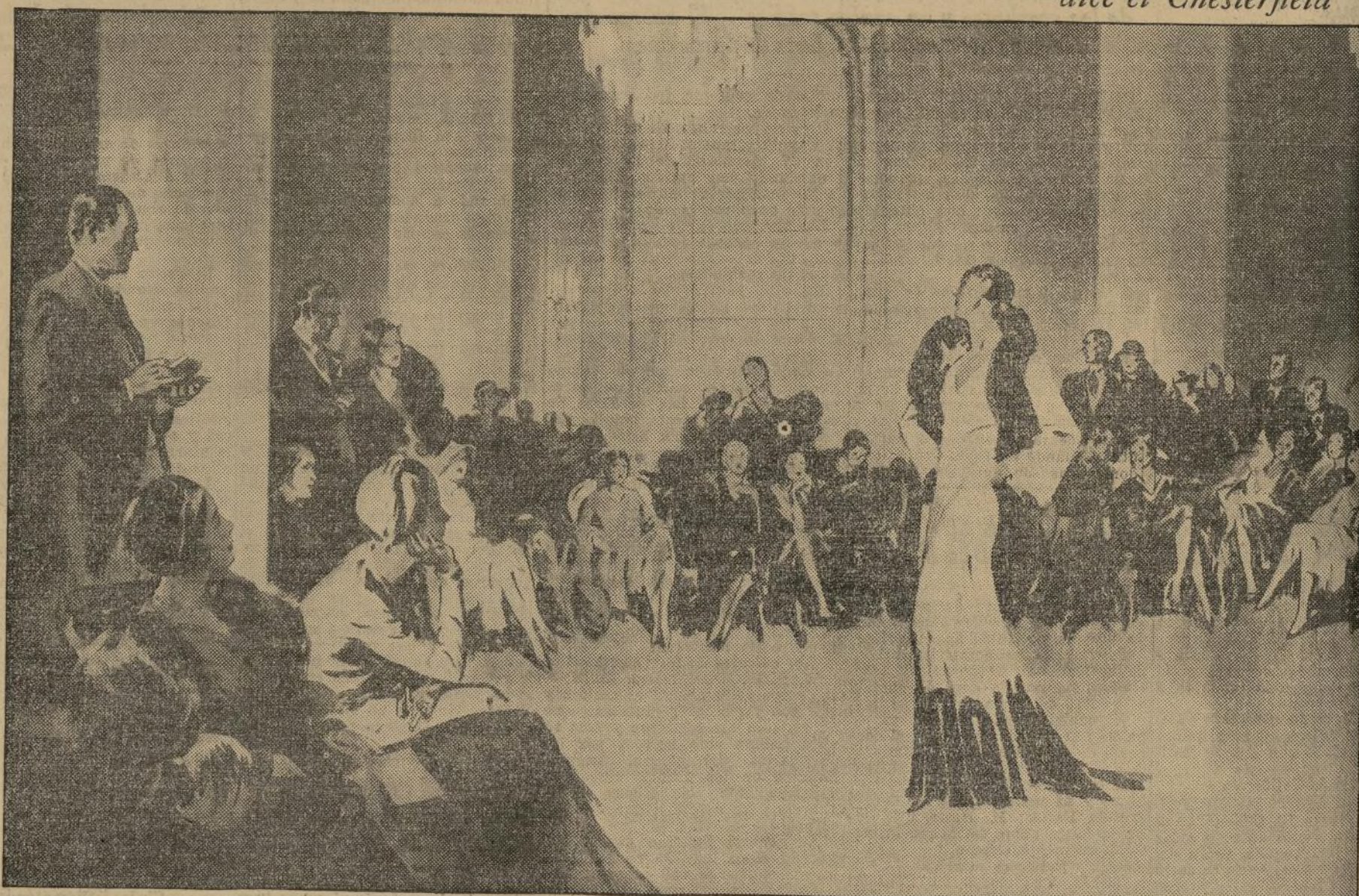
© 1931, LIGGETT & MYERS TOBACCO CO.

pero estoy siempre de moda en todas partes"