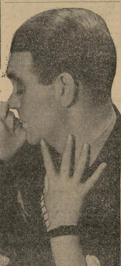
Helen Twelvetrees y Robert Ames en una escena de "Mittie", que se empezará a exhibir en el "Mt. Morris" el sábado.

Claudette Colbert y su esposo, Norman Foster, se vieron separados por nada menos que toda la anchura del continente norteamericano el día de Nochebuena, pero con la esperanza de reunirse muy en breve, tan pronto como Norman concluya su trabajo en la película de Clara Bow "No Limit".