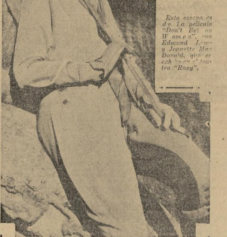
Esta escena es de la película "Don't Bet on Womankind", con Edmund Lewis y Jeanette Mac Donald, que se exhibe en el teatro "Roxy".