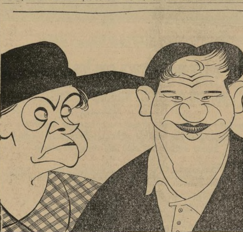
Virginia Fábregas, la celebrada actriz mejicana, y Juan de Landa, el ya popularísimo actor vasco, en una escena de "La Fruta Amarilla", muy interesante cinta toda hablada en español que viene al "San José" el próximo viernes.