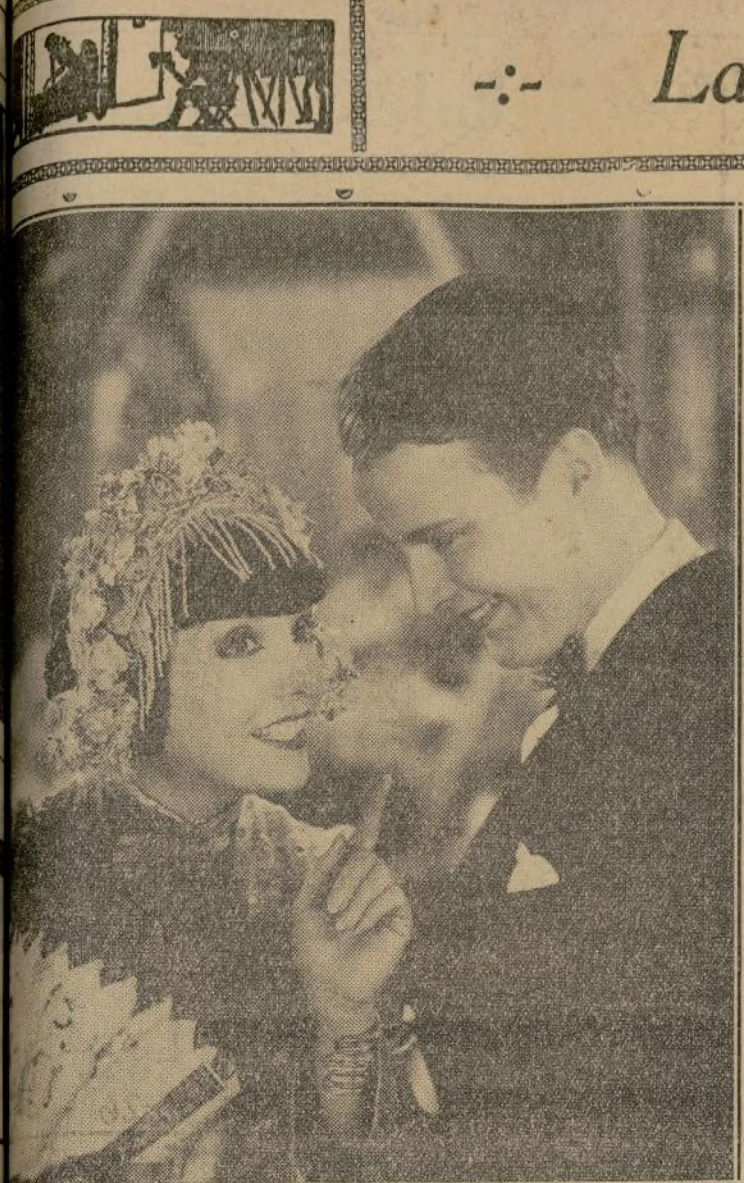
La popularísima artista mexicana Lupe Vélez con Barry Norton, en escena de la cinta, toda hablada en español, "Oriente y Occidente", exhibida hoy en el teatro "Gaiety" de Brooklyn.