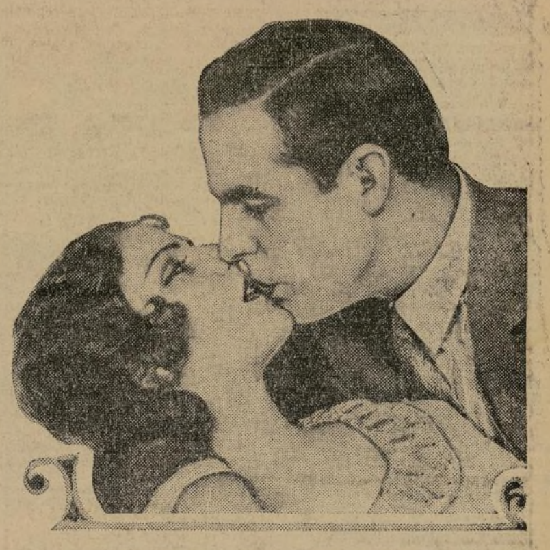
"La Dama Atrevida" justifica su nombre en esa película, toda hablada en español, que se empieza a proyectar sobre el lienzo del "San José".