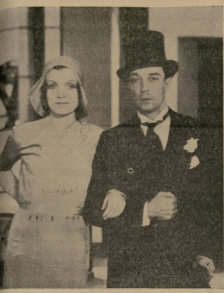
Una escena de la chistosa película toda hablada en español "De Frente Marchen!", con el genial Buster Keaton y Conchita Montenegro. Se exhibiendo desde hoy en el teatro "Gil" de Brooklyn.