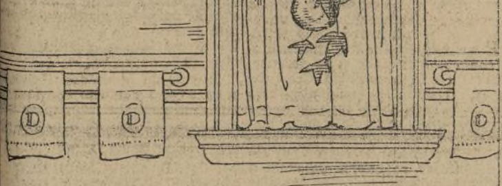
Costa en forma de bisco, bonita y útil.

Deben tenerse gavetas de todos tamaños a mano. Algunas con extremadamente angostas para ocultar cosas.