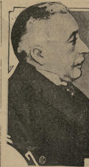
General J. Aznar

La expedición aérea de Balchen es la última esperanza que queda para poder hallar a la veintena (Sigue en la 4a. pág.)