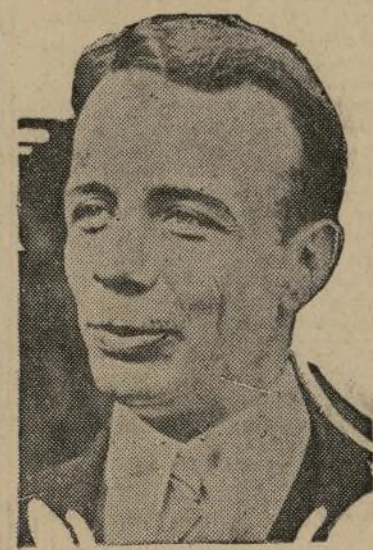
Gobernador Theo. Roosevelt

La situación actual ha dado origen a un exacerado rumor de que Lloyd George está negociando con los laboristas y algunos rumores hasta a decir que se le ofrece un portafolio en el gabinete de MacDonald, que sería entonces un