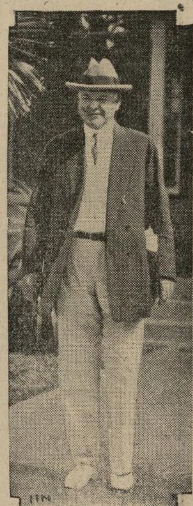
El presidente Herbert Hoover

SAN JUAN, P. R., marzo 24.—Desde un templete levantado en el balcón del Capitolio insular, el presidente de la nación, Mr. Hoover, se dirigió al pueblo puertorriqueño aglomerado frente al majestuoso edificio. En frases entusiastas para el porvenir manifestó su admiración ante el resurgimiento de la isla dentro del período de una generación. "Levantándose del abandono a un puesto elevado en la marcha del progreso," dijo, "un pueblo capacitado e inteligente puede lograr dentro de las próximas horas, no sé de hecho, pero en este sentido más notable que en el pasado, el pueblo de esta isla." "Es esto," dijo el primer magistrado, "un magnífico ejemplo de lo que puede lograr dentro de las próximas horas, no sé de hecho, pero en este sentido más notable que en el pasado, el pueblo de esta isla."