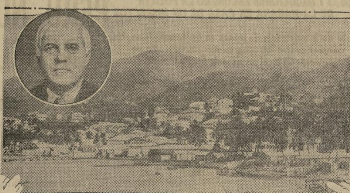
Vista general de la ciudad de St. Thomas, capital de las Islas Vírgenes, visitada hoy por el presidente Hoover y su comitiva como punto final en la excursión que el primer magistrado de la nación lleva a efecto por el mar Caribe. Los distinguidos visitantes serán huéspedes del doctor Paul Martin Pearson (círculo), recientemente inaugurado como gobernador de dichas posesiones nacionales.