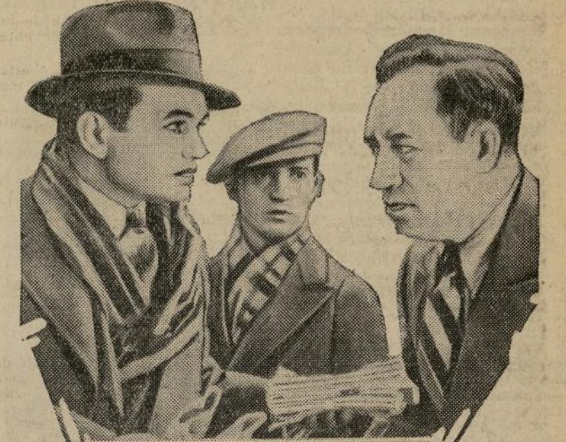
"Little Caesar" visita esta semana el teatro "Jewel" con Edward G. Robinson y sus demás secuaces.

A pesar de los intereses creados que al presente existen y los obstáculos que ofrece la parte financiera, es de confiar que la ópera española prevalecerá en la escena para los públicos de este idioma.