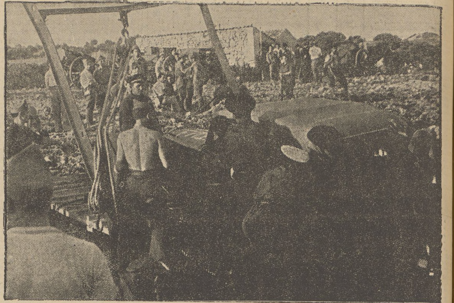
Darrera els soldats i milicians, des embarcaren els automòbils — auxiliars importants en aquesta guerra — darrera els canons i municions