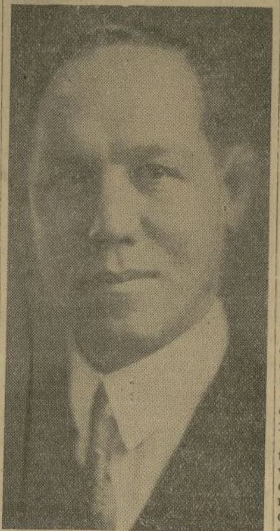
Doctor Olaya Herrera

El presupuesto español para 1930 es de 3.650,000,000 de pesetas