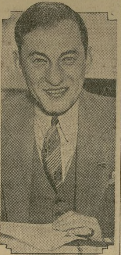
Alcalde James J. Walker

En favor de los niños pobres de Puerto Rico, que víctimas del hambre y las enfermedades, sufren un