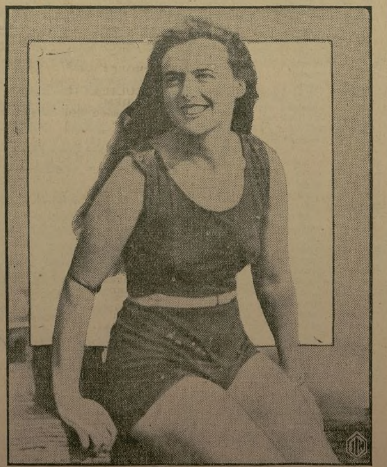
Mercedes Gleitze, la mecanógrafa inglesa que se hizo famosa en 1927 atravesando a nado el Canal de la Mancha, acaba de realizar otra proeza de natación nadando continuamente por espacio de 26 horas, al cabo de las cuales se desmayó y tuvo que ser sacada del agua.