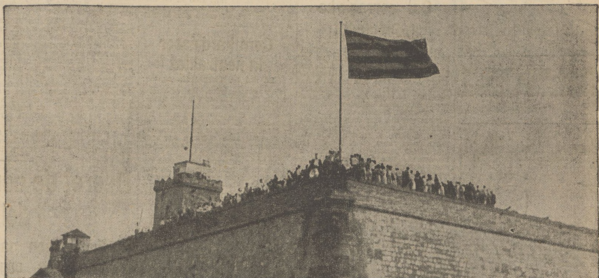
Ben alta, ben dreta, ben sola, la bandera catalana que a tots ens representa, pot ésser el símbol que resumeixi la significació de les lluites que s'estan lliurant arreu d'Espanya contra l'opressió, contra el militarisme, per la llibertat.

EL TEMPS. — A Catalunya: El temps és variable per tot el país. S'observa cel núvol a les conques de Barcelona, part de les de Girona, Tarragona i conca de Tremp. Cel serà a l'Alt Pirineu, Lleida i curs inferior de l'Ebre. Els vents són fluïxos amb predominació dels de Llevant. La temperatura màxima a Pobla de Segur ha estat de 35 graus; la mínima a Ransol, de 3 graus.