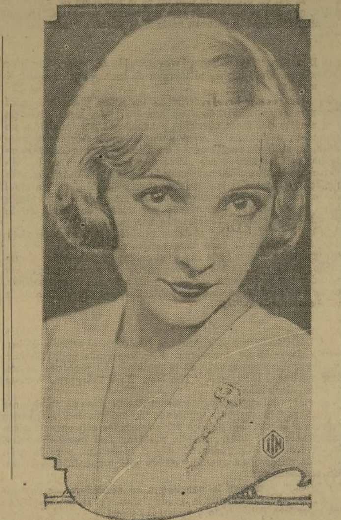
Resucitando una costumbre ya desaparecida, la moda acaba de imponer ahora el hábito de lucir el reloj prendido en el vestido, a la usanza, que tan en boga estuvo, hace algunos años.