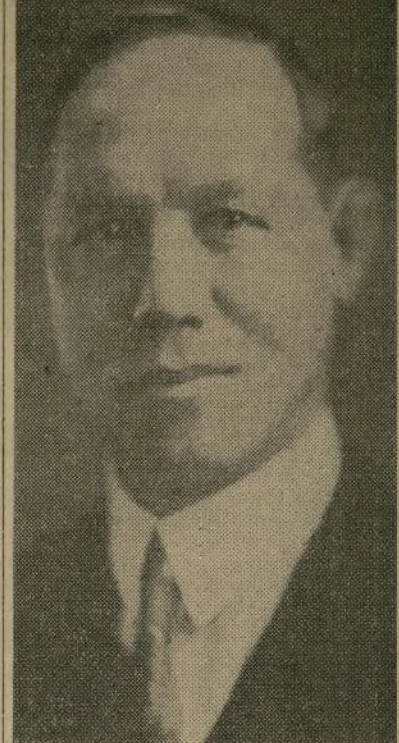
Doctor Olaya Herrera

Por segunda vez se utilizó en el año 1842, cuando el rey Víctor Manuel II, contrajo matrimonio con María Adelaida de Lorena, archiduquesa de Austria, y después durante la boda, celebrada en Florencia, del príncipe Humberto, que posteriormente al tomar posesión de la corona murió asesinado, con Margarita de Saboya. Desde entonces la carroza había estado religiosamente guardada como una reliquia de la casa de Saboya.