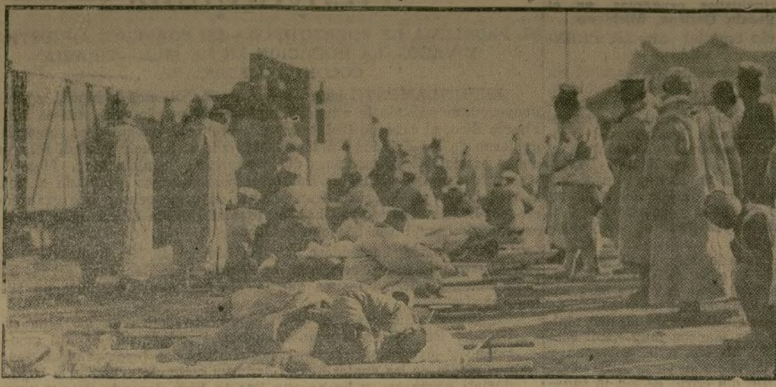
Soldados chinos heridos, tendidos en sus camas, en la estación de Loyang, en espera del tren que ha de conducirlos al hospital de Cheghow. El gobierno nacionalista chino estuvo a punto de sufrir un serio descalabro, pero el resultado final de la batalla, según el general Chiang Kai-Shek, le fué favorable, salvándose así la situación.