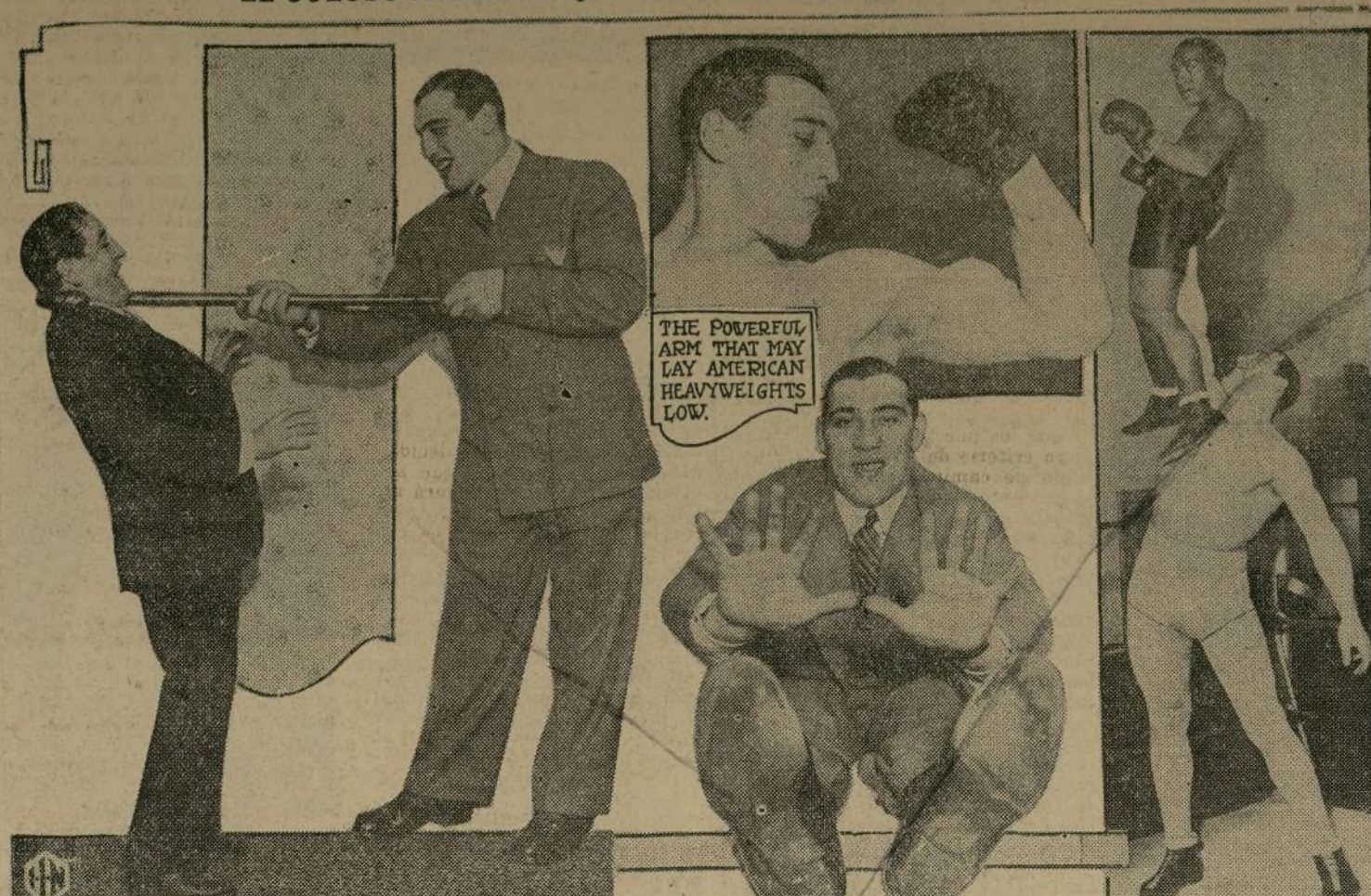
Bastón de 14 libras, zarzates de medida 17, cuello de 20 y 285 libras de peso. Primo Carnera hace una imponente figura de gladiador moderno y, al menos por sus colosales proporciones físicas, representa una verdadera amenaza para la supremacía pugilística yanqui. Su brazo ha merecido ya de los críticos del país la pequeña inscripción que, traducida al español, lee así: "Este poderoso mazo puede derribar a muchos máximos americanos".

EL COLOSO ITALIANO QUE AMENAZA LA SUPREMACIA YANQUI