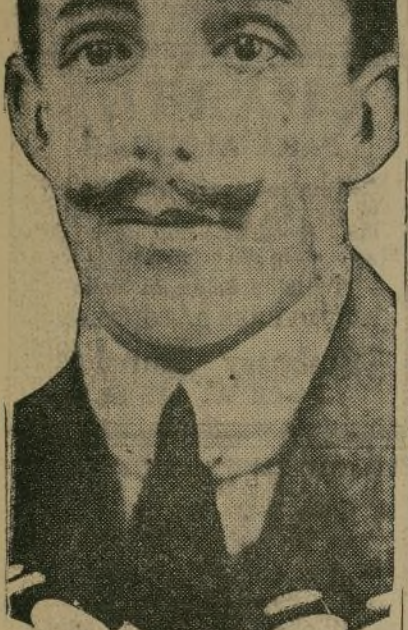
Thomas A. Edison

Selecciones de "La Luna Nueva": "Villancico de la Virgen".....Lehar "Villancico de la Virgen".....Grever "Villancico de la Virgen".....Prim "Villancico de la Virgen".....Chopin "Villancico de la Virgen".....Rubell "Villancico de la Virgen".....Massenet "Villancico de la Virgen".....Mendels "Villancico de la Virgen".....Robert "Villancico de la Virgen".....Liszt "Villancico de la Virgen".....Händel