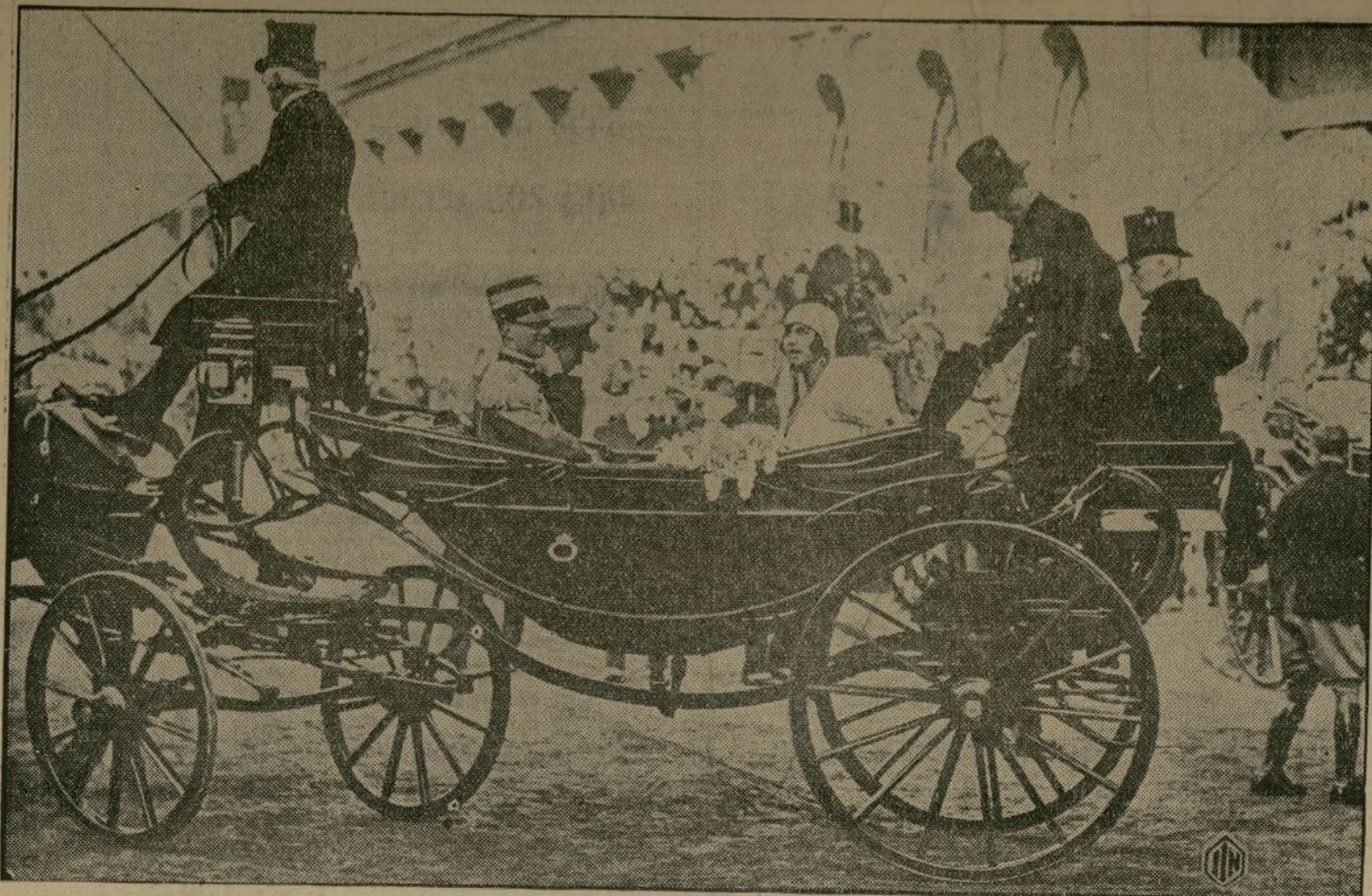
Después de la boda del príncipe Humberto con la princesa María José de Bélgica, se transmitieron radiográficamente desde Roma a Nueva York, varias fotografías, algunas de las cuales fueron publicadas por LA PRENSA. Esta que aquí aparece y que muestra a la llegada de la princesa a Roma, pertenece a la serie que ha sido recibida por correo.