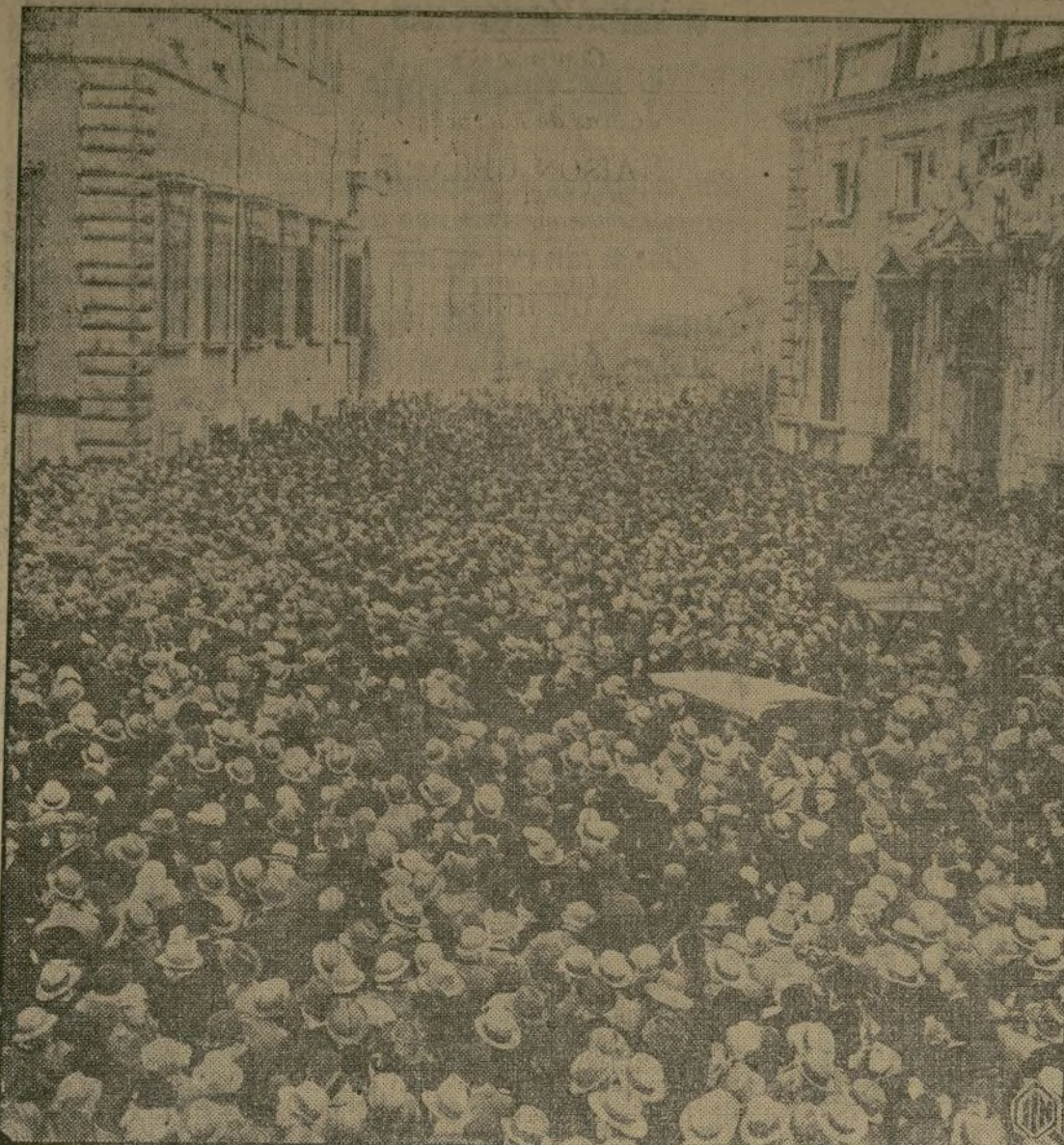
Cuando la princesa María José llegó a Roma, pocos días antes de su casamiento con el príncipe Humberto, heredero a la corona de Italia, LA PRENSA publicó detalles de las grandes demostraciones de simpatía y de afecto que le había dispensado el pueblo, que se emocionó durante varias horas, frente al palacio del Quirinal, aclamándola. En esta fotografía puede verse una reproducción gráfica de la multitud en esos momentos.