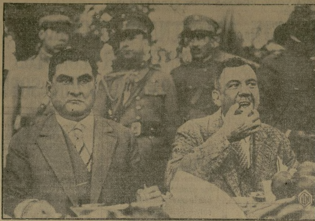
El actual presidente de Méjico y el expresidente general Plutarco Elías Calles, durante la celebración del banquete popular con que fueron obsequiados a su llegada a Puebla hace pocos días.