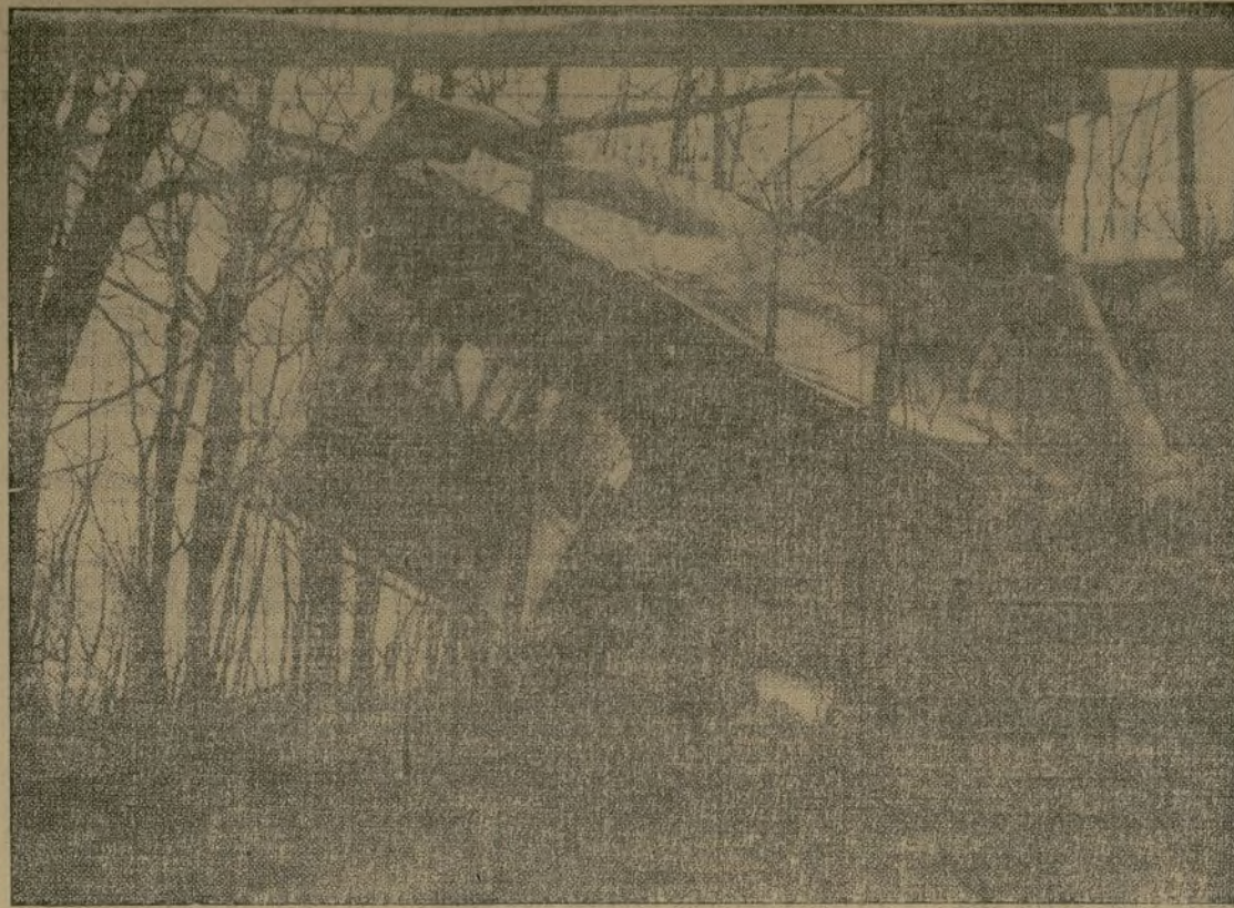
Estado en que quedó el pequeño dirigible “Paritan,” después de haber caído en las montañas situadas en los alrededores de Lee City, Ky. Afortunadamente para los tripulantes, ninguno de ellos sufrió lesiones de consideración.