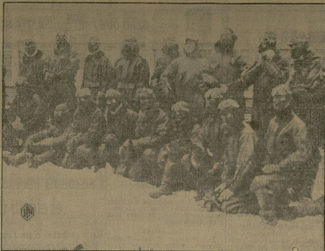
Los pilotos del ejército de los Estados Unidos, que han participado en el gran raid en que han tomado parte 21 aeroplanos, han utilizado un equipo especial, que se ha probado para determinar su eficacia y utilidad en las bajas temperaturas.