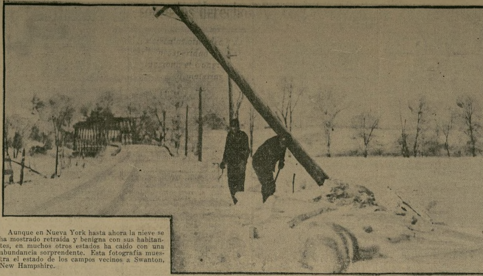
Aunque en Nueva York hasta ahora la nieve se ha mostrado retraída y benigna con sus habitantes, en muchos otros estados ha caído con una abundancia sorprendente. Esta fotografía muestra el estado de los campos vecinos a Swanton, New Hampshire.