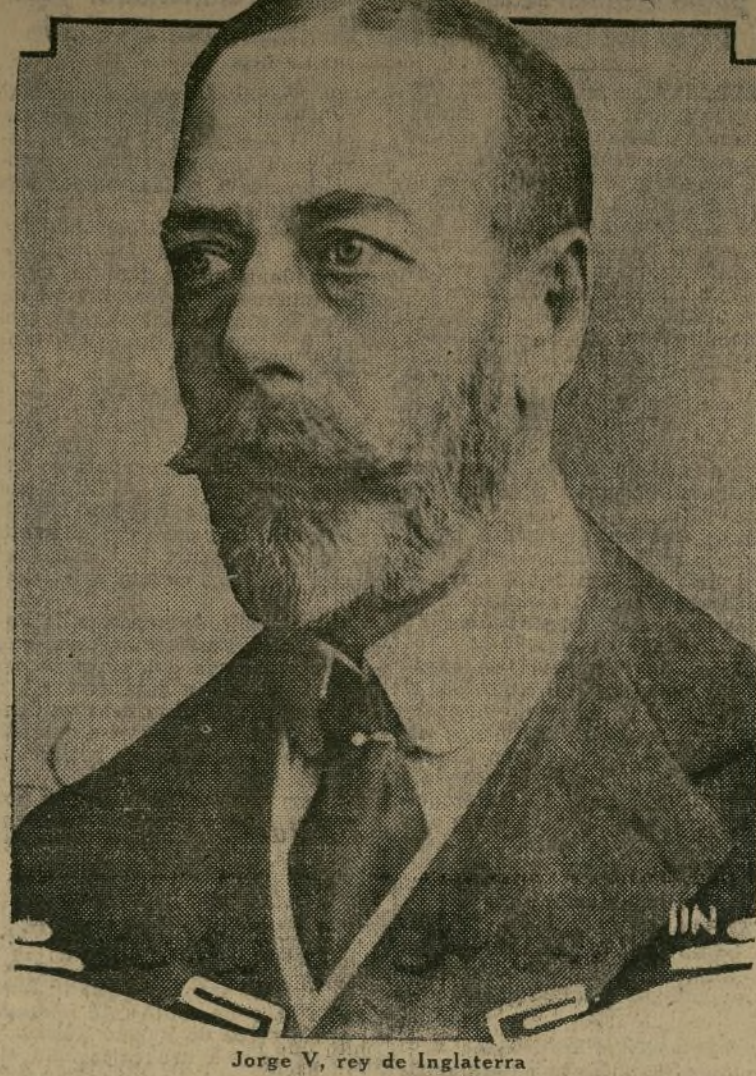
Jorge V., rey de Inglaterra