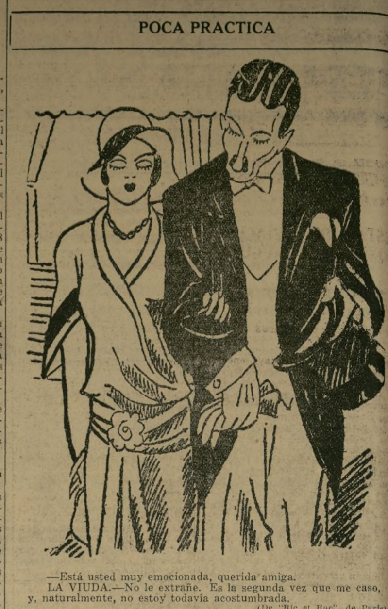
—Está usted muy emocionada, querida amiga. LA VIUDA.—No le extrañe. Es la segunda vez que me caso, y, naturalmente, no estoy todavía acostumbrada. (De "Ric et Rac", de Paris)