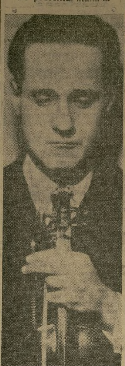
Alfredo San Malo

Los críticos musicales de varios países de Europa y América, han acordado los calificativos encomiásticos al hablar de la labor del célebre violinista panameño que se presentará nuevamente mañana domingo en esta ciudad, en el Mecca Auditorium.