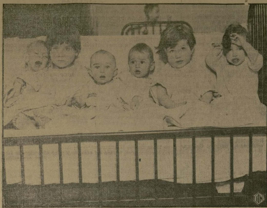
Niños que han tenido que ser atendidos en el hospital de Elizabeth, N. J., después de haberse descubierto que en la granja en que se les cuidaba no eran atendidos en la forma debida.