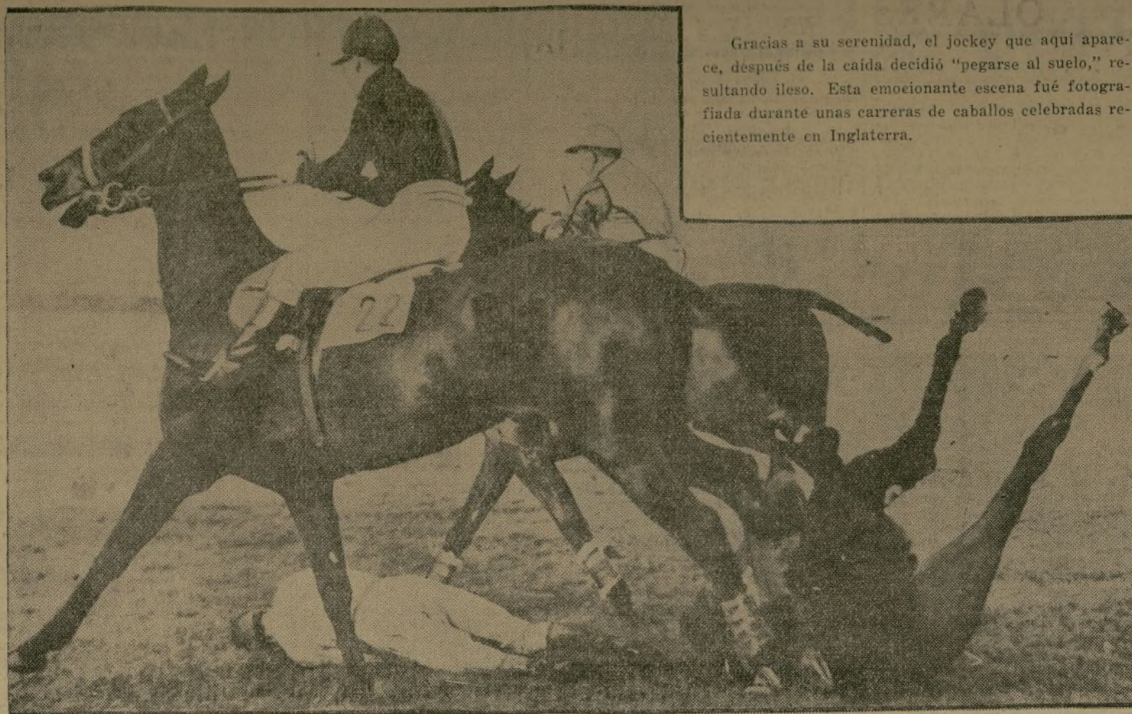
Gracias a su serenidad, el jockey que aquí aparece, después de la caída decidió "pegarse al suelo," resultando ileso. Esta emocionante escena fué fotografiada durante unas carreras de caballos celebradas recientemente en Inglaterra.