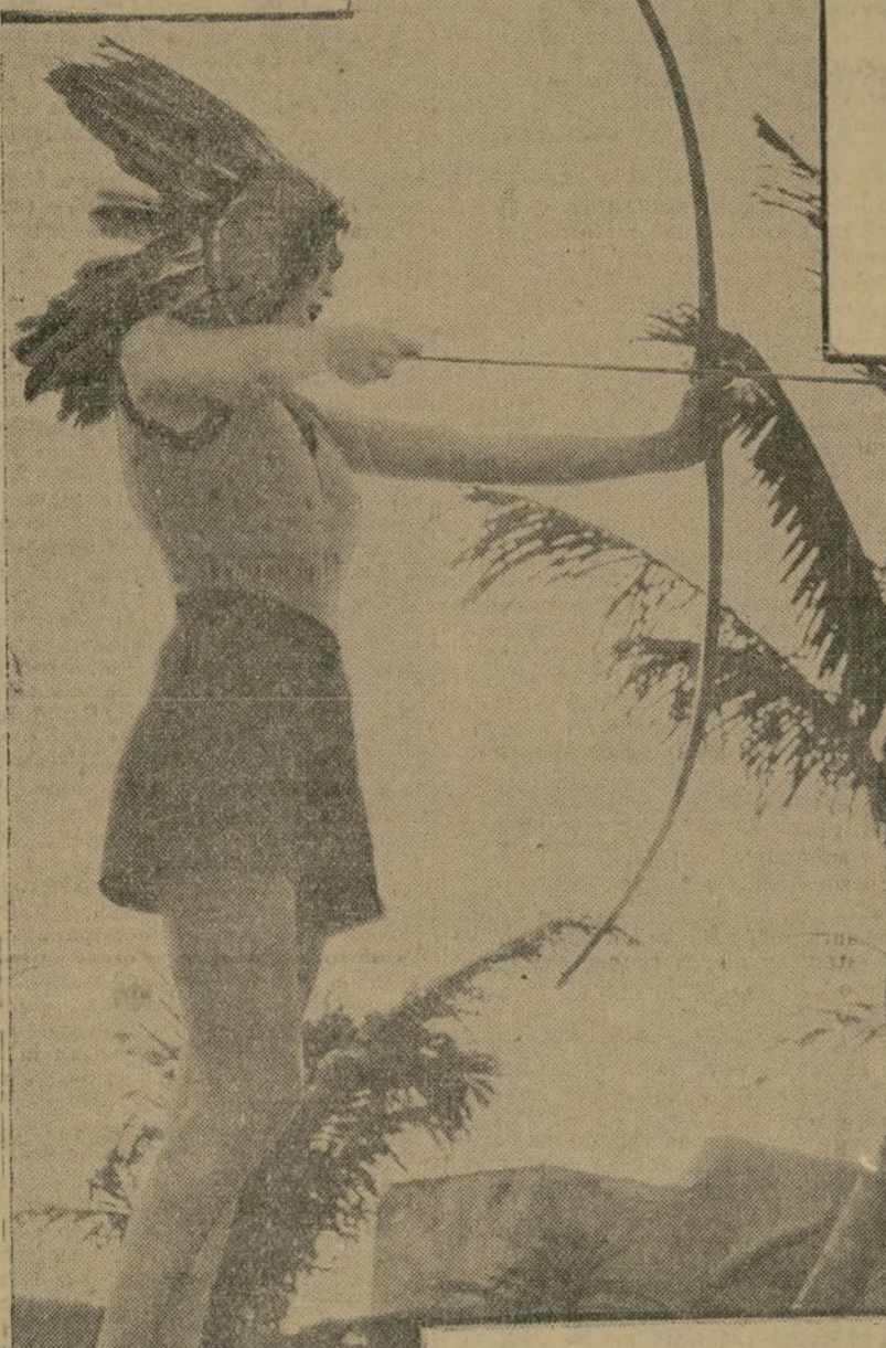
El deporte de tiro de flecha se ha puesto de moda, especialmente en las playas de la Florida y Ethel Merman lo practica con toda la ley; no hay más que fijarse en su indumentaria para convencerse.