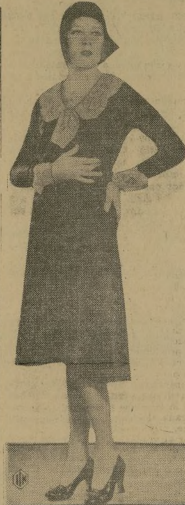
Vestido de tarde, de líneas severas y elegantes que realzan la bella silueta de la modelo que lo presenta.

azúcares en el mercado. Un dólar de salario por ocho horas de trabajo es la demanda de los campesinos, que el Negociado por medio de su jefe cree es exagerada.