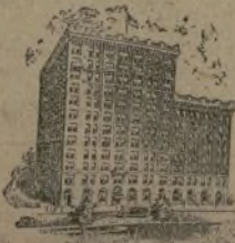
HOTEL PARK PLAZA 50 Oeste Calle 77 A la entrada del Central Park. Cuarto para 2 personas, $4. Semanalmente, $20.

Cuarto para 2 personas, $4. Semanalmente, $20. Cita aquí y libremente amueblados. El mejor hotel de la parte Oeste. Para reservas llame al manager, Sr. Chiorrillo, Tel. Edicott 3795.