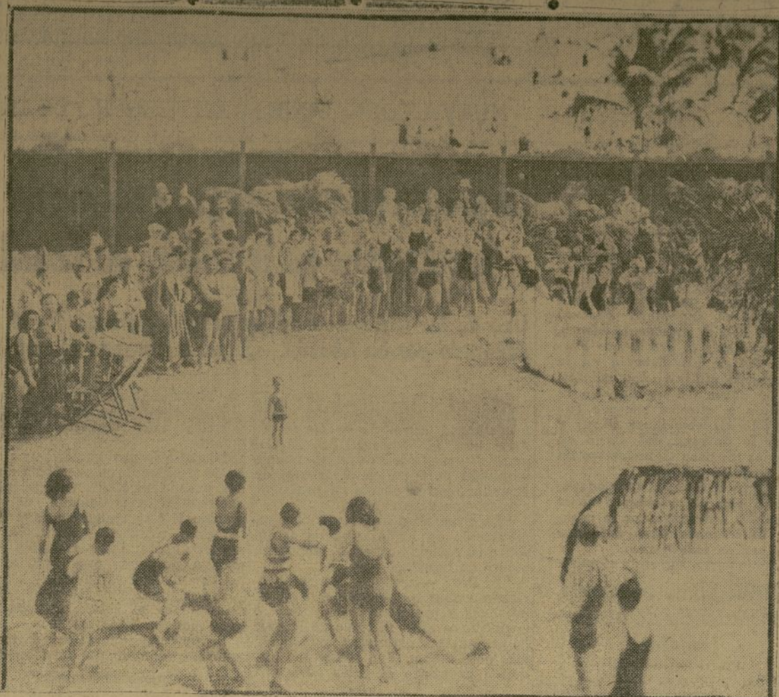
Mientras en otros estados la nieve y el hielo obligan a quedarse en casa y a estornudar de vez en cuando, en algunas de las playas de la Florida se practican con ardor los deportes más veraniegos.