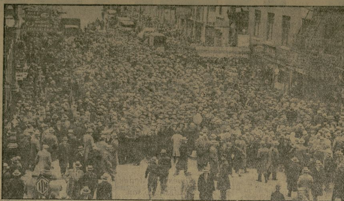
El primer día de la huelga de obreros del ramo de confección, dió como resultado una animación extraordinaria en las calles que forman el barrio en el cual están situados la mayoría de los talleres, animación que en algunos sectores llegó a impedir el tránsito. Esta fotografía fué tomada en la calle 34 esquina a la séptima avenida.