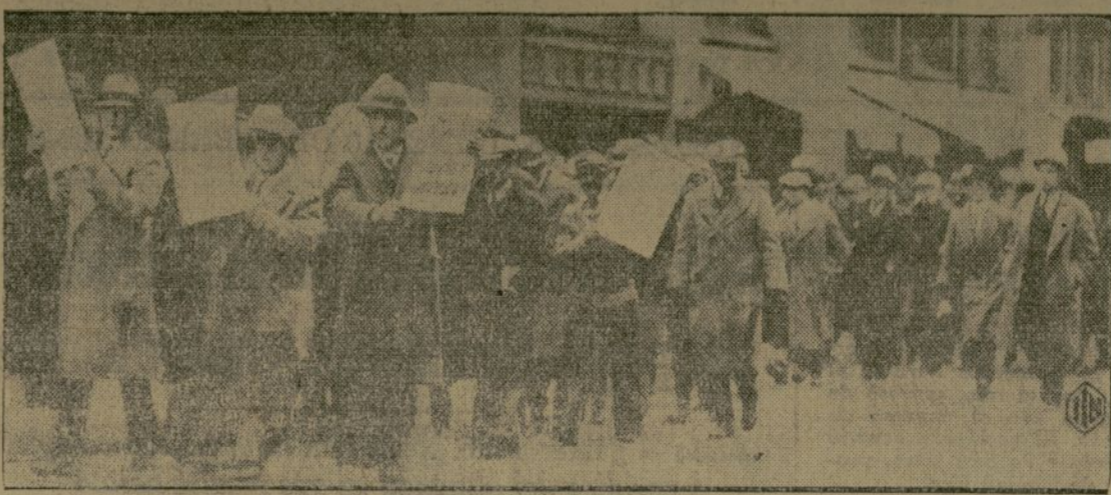
Las calles de Boston fueron escena hace poco de una manifestación comunista en la que desfilaron varios entusiastas llevando cartelones y banderas. La policía intervino y disolvió a los manifestantes, practicando además algunas detenciones.