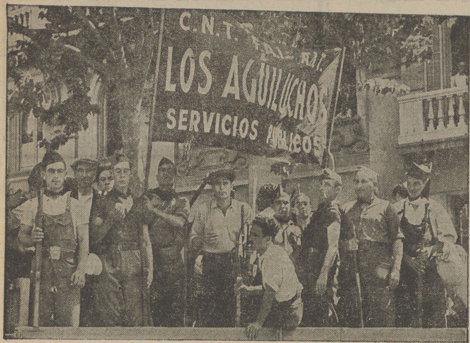
Ahí desfilla pels carrers de Barcelona en diversos camions, la columna «Els Aguilons» de la F. A. I., que van a unir-se a les forces que lluiten per la llibertat a terres d'Aragó. La desfilla vibra d'entusiasme i enfronta el seu optimisme als ciutadans que a la reraguarda segueixen amb ansietat les incidències de la lluita.