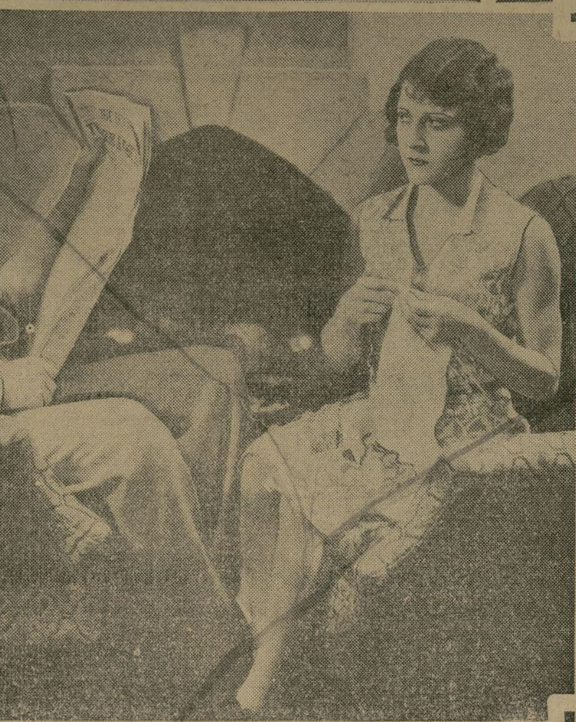
Grant Withers y Patsy Ruth Miller en una escena íntima de "So Long Letty", comedia musical adaptada a la cinematografía que se exhibe esta semana en el "Strand".