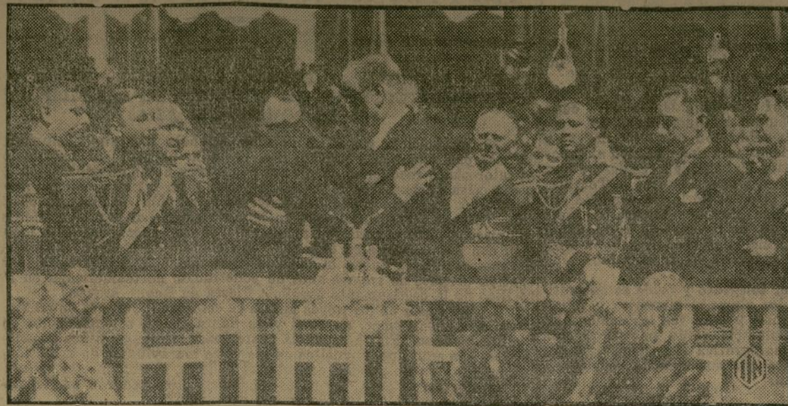
Cuando el presidente de Méjico, señor Ortiz Rubio, tomó posesión del cargo, el presidente saliente señor Portes Gil le abrazó ante las personas que se habían congregado para presenciar el acto.