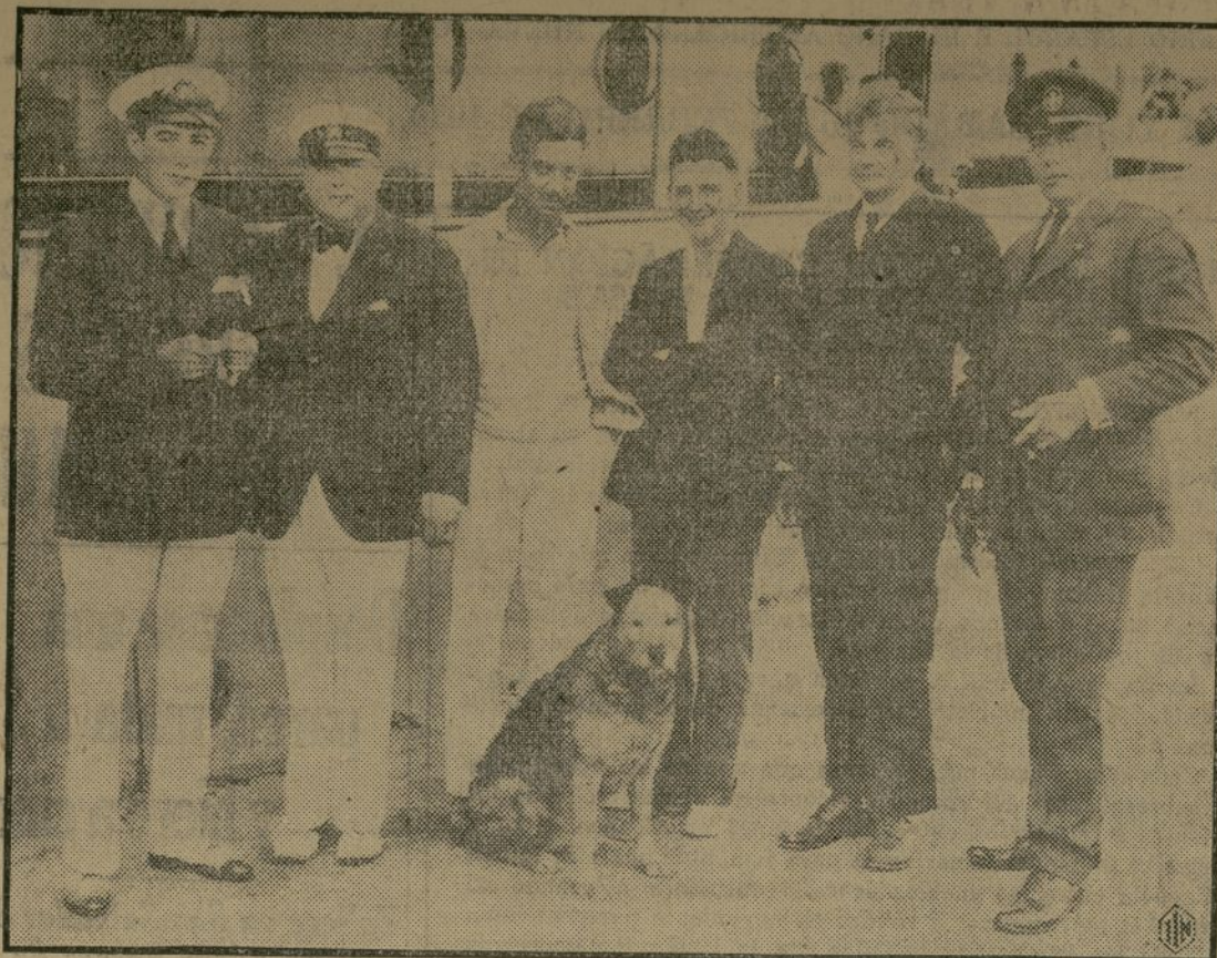
Un grupo de capitalistas y hombres de ciencia acaba de llegar a Miami después de haber recorrido el Pacífico en varias direcciones durante cuatro semanas a bordo del yate "Mizpah."