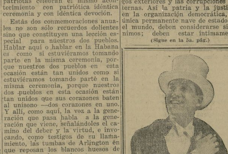
JOSE BOHR Estrella de la película sonora en español

Poder, fuerza, beneficios materiales, riquezas, son útiles auxiliares del bien, pero no constituyen el bien en sí. Cuando una nación los aprueba como su única meta y los considera como su sola aspiración, está condenada a derrumbarse. La justicia, que es la sabiduría humana en la apreciación del bien, es la base de toda civilización perdurable. Ella se da en alma y vida y se mantiene invencible contra los enemigos exteriores y las corrupciones internas. Así la patria y la justicia en la organización democrática, la única permanente nave de estado en el mundo, deben considerarse sinónimos; deben estar íntimamente (sigue en la p. 2a.)