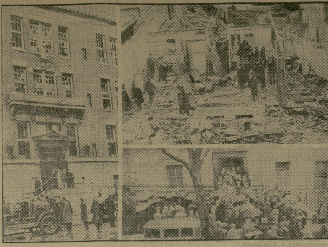
Un escape de gas causó una explosión de gran fuerza que, además de romper los cristales de una escuela pública, situada en las inmediaciones, ocasionó heridas a más de cincuenta niños que, en el momento de ocurrir aquella, se encontraban en ese centro docente.