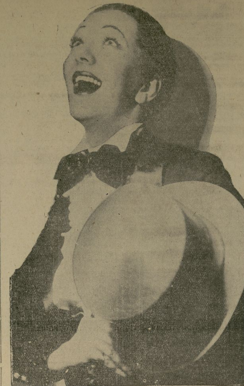
De prestigio reconocido en la escena dramática, Gertrude Lawrence se ha pasado a la producción musical, y aquí la vemos en uno de los momentos más animados de Lew Leslie's International Revue, que se estreña esta semana en el "Majestic Theatre".