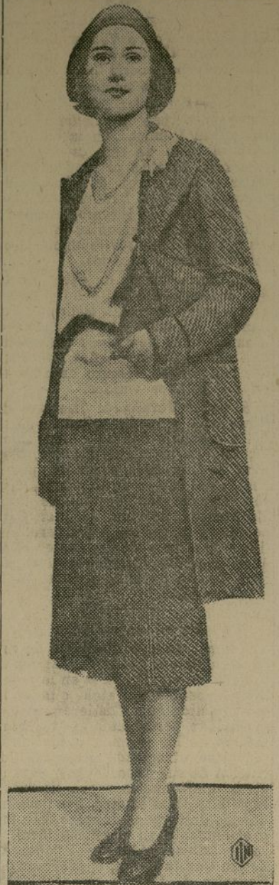
Nuevo modelo de primavera que ha hecho furor en París y que no pasará mucho tiempo sin que lo veamos por las calles de Nueva York.