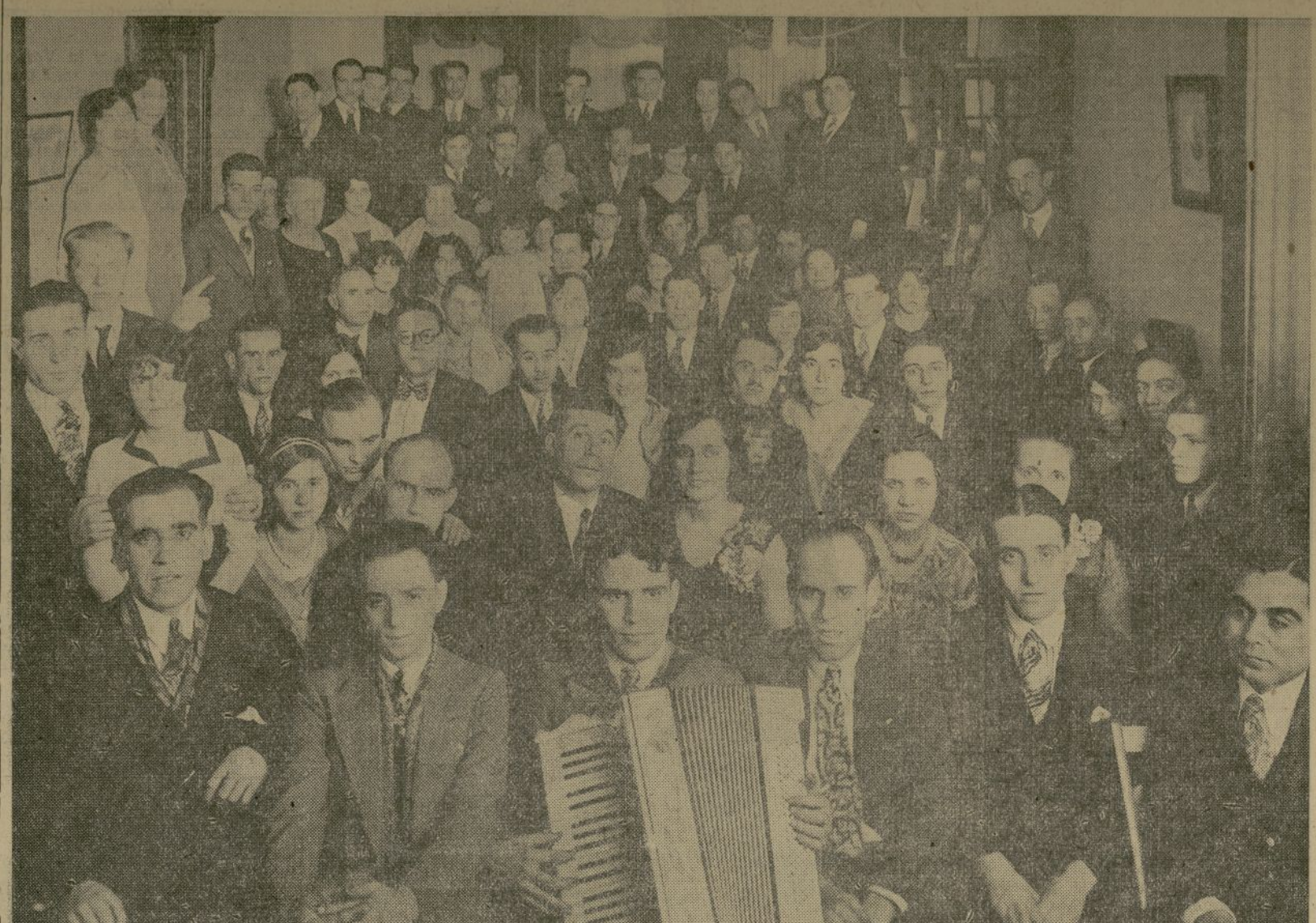
Fotografía de los asistentes a la última velada celebrada por la Sociedad Naturista Hispana de esta ciudad, y en la cual participaron distinguidos líderes en el campo del Naturismo, terminando con un lucido baile.

6.30 P. M.—Orquesta. 7.00 P. M.—Amos y Andy. 7.15 P. M.—Romance en el conservatorio. 7.30 P. M.—Música y vocalista. 7.45 P. M.—Contralto, barítono y orquesta. 8.00 P. M.—Comedia, música y orquesta. 8.15 P. M.—Idem. 8.30 P. M.—Idem. 8.45 P. M.—Idem. 9.00 P. M.—Idem. 9.15 P. M.—Idem. 9.30 P. M.—Idem. 9.45 P. M.—Idem. 10.00 P. M.—Idem. 10.15 P. M.—Idem. 10.30 P. M.—Idem. 10.45 P. M.—Idem. 11.00 P. M.—Idem.