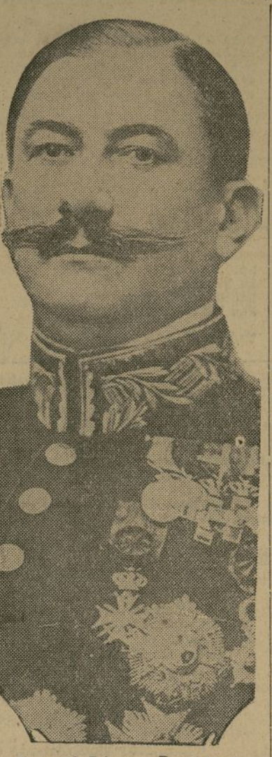
General Dámaso Berenguer

Declara que la tarea más difícil es restaurar un gobierno constitucional