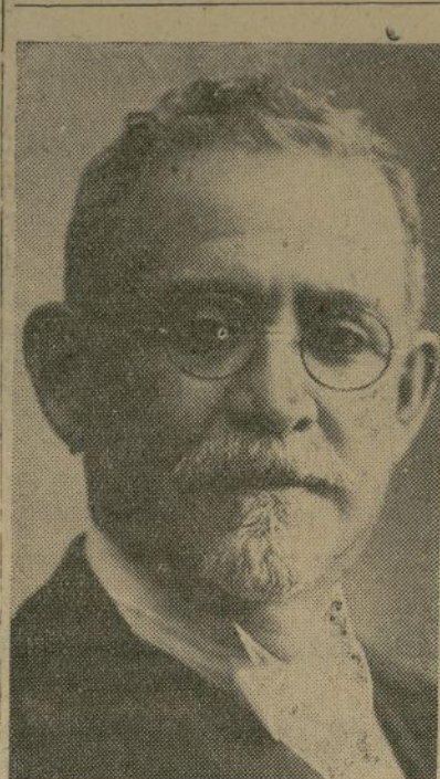
General Horacio Vásquez