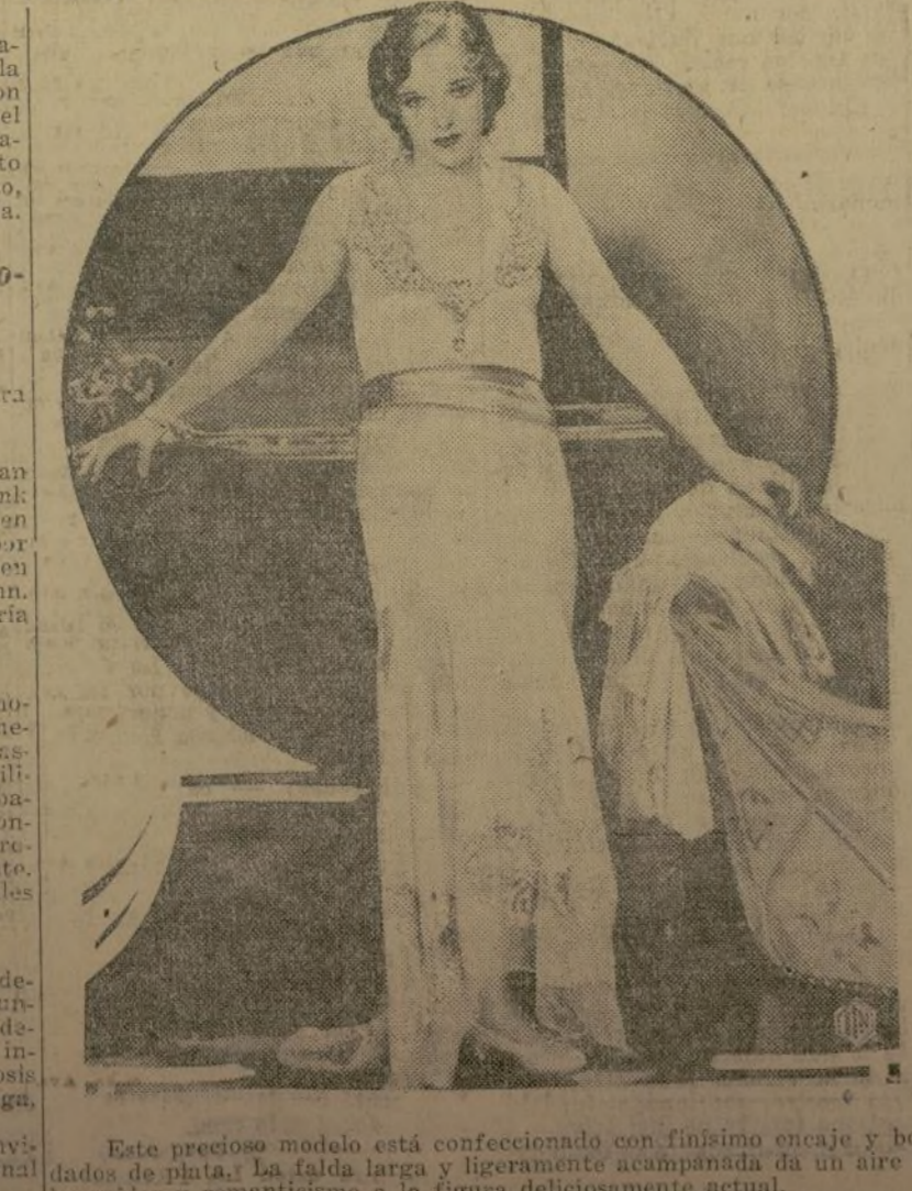
Este precioso modelo está confeccionado con finísimo encaje y bordados de plata, la falda larga y ligera, es acompañada de un aire de languidez y romanticismo a la figura deliciosamente actual.