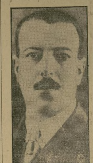
Señor Julio Prestes

Admítase que la opinión triunfó en la capital, Río Grande do Sul, Parahyba y Minas Geraes.—La votación fué ordenada