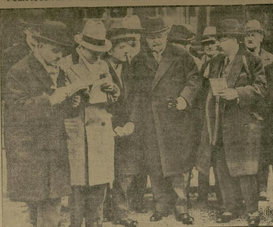
Grupo de políticos y periodistas franceses tomando notas sobre la caída de Tardieu que les da M. Euisson, (en el medio) presidente de la Cámara de diputados, cuando abandonaba el palacio de los Campos Elíseos. Chautemps, jefe de la mayoría izquierda francesa fué elegido como sucesor de Tardieu, pero sólo duró su candidatura hasta que se declaró el voto de confianza.