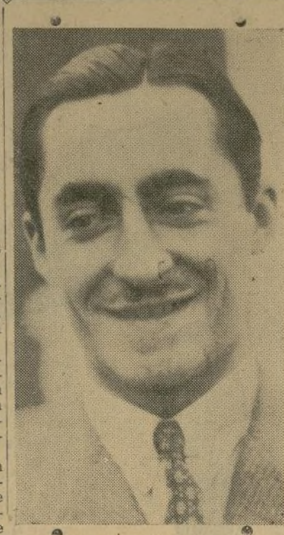
Miguel Primo de Rivera hijo

SANTO DOMINGO, marzo 3. (P).—El general Horacio Vásquez, por treinta años héroe popular de Santo Domingo, se encuentra hoy en un hospital, destruido física y políticamente. La aceptación de su renuncia como presidente por el congreso nacional se cree que ha terminado su carrera política. Con más de 70 años de edad, su restablecimiento físico sería tan milagroso como su retorno a la política. El congreso aceptó, al mismo tiempo, la renuncia del vicepresidente Alfonso. Ambas renuncias fueron aceptadas "con mucho gusto".