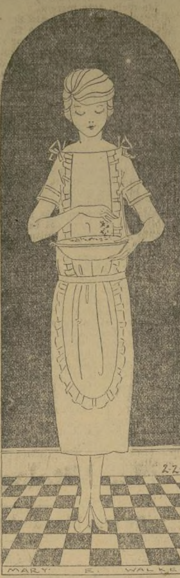
REGLAS PARA SER FELIZ

Se necesitan 20 centavos en sellos o en moneda para hacer este modelo. Se mandan patrones con sólo enviar 20 centavos en sellos o en moneda.