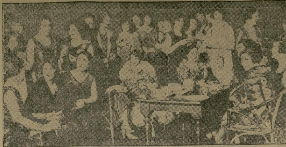
Las jóvenes secretarías, después de las sesiones de la Conferencia Naval del Desarme, esparcen su espíritu al modo inglés en un animado té en el famoso Crosby Hall en Chelsea, el barrio bohemio de Londres. Ninguna de ellas parece estar muy preocupada con los trascendentales problemas que están planteando los grandes dignatarios.