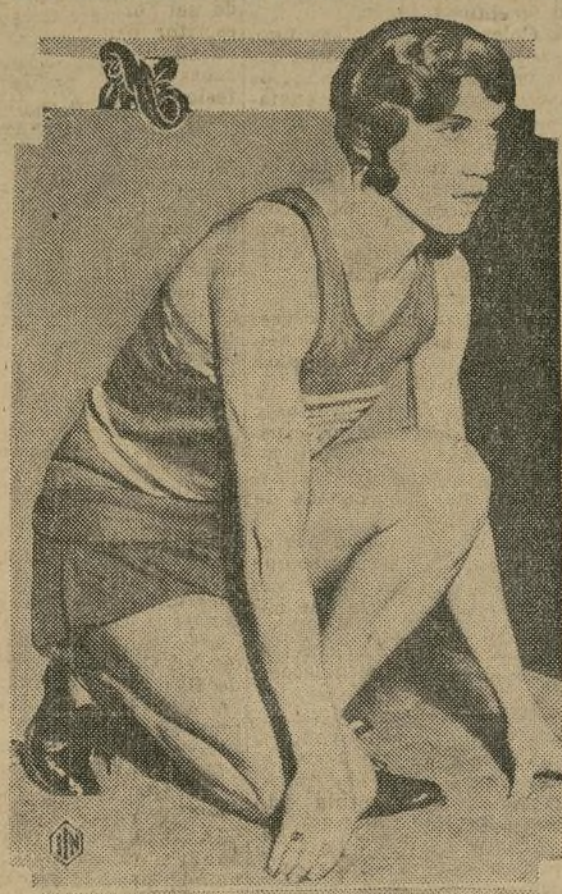
Stella Walsh, reputada como la mujer más veloz del mundo, tomará parte en las pruebas atléticas de los Knights of Columbus, que se verificarán en breve en esta ciudad.

Luca de Tena pone sus periódicos a disposición de la campaña monárquica