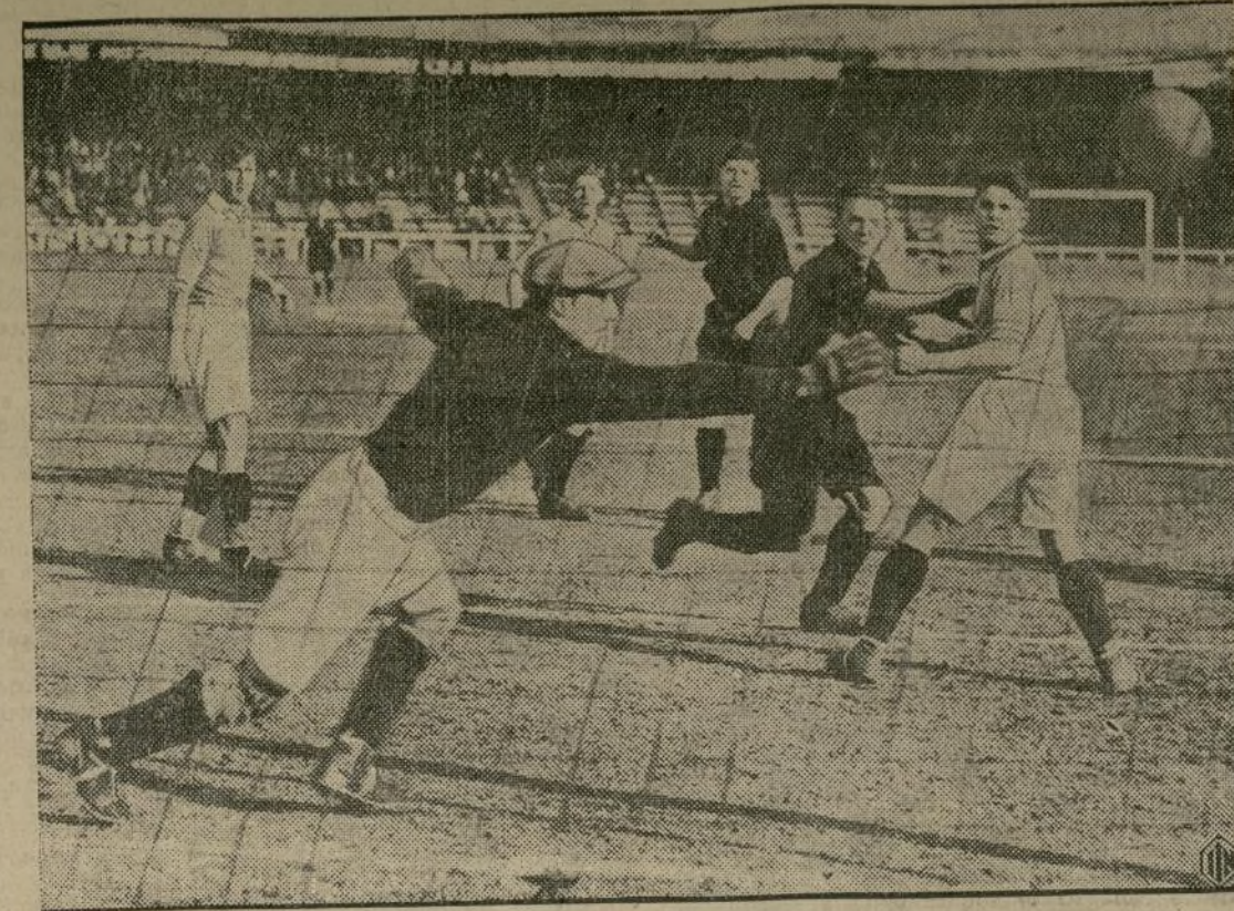
Emocionante momento durante el reciente encuentro militar de fútbol entre Bélgica y Inglaterra. El portero inglés dispónese a hacer una difícil parada.