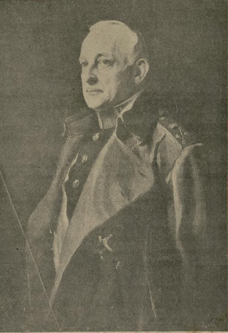
GENERAL PRIMO DE RIVERA

PANAMA, 16 de marzo. (P).—El remolcador de la armada de los Estados Unidos "Sciota", ha recibido orden de salir a toda marcha para auxiliar al vapor "Unicoi", cuya situación es desesperada yendo a la deriva a 880 millas de Balboa. Se espera que el remolcador rescate a la tripulación a cien millas al oeste de Galápagos. Dicho buque estaba efectuando la travesía Estados Unidos-Australia, llevando nueve pasajeros a bordo. Se ignoran las causas del desastre.