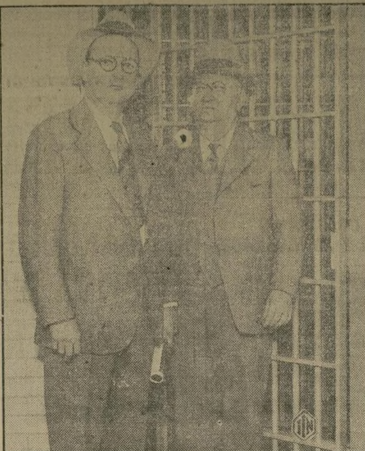
Ara Keyes, ex-abogado del distrito de Los Angeles, fotografiado en el momento de abandonar su celda en la cárcel del condado, con dirección a la prisión de San Quintín, donde permanecerá por un periodo de uno a catorce años, bajo la inculpación de soborno.