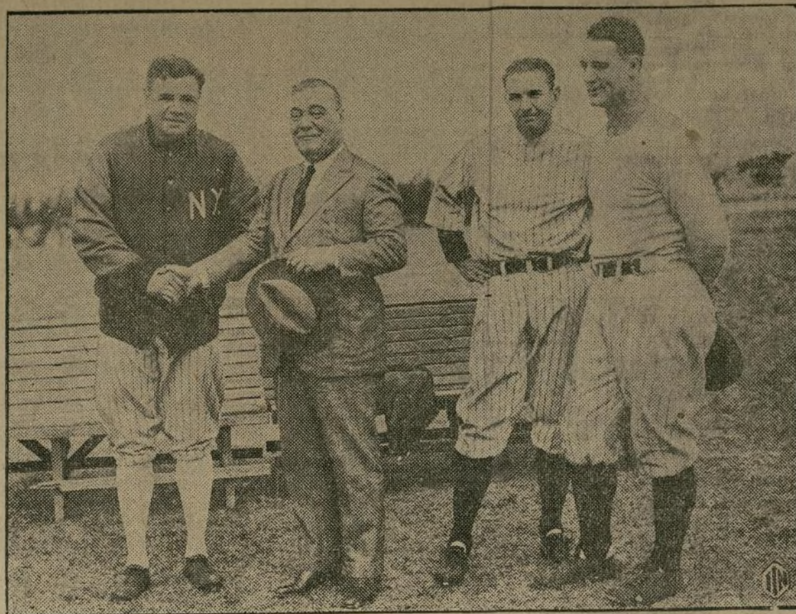
He aquí al coronel Jacob Ruppert, propietario de los New York Yankees, en medio de Babe Ruth, Bob Shawkey y Lou Gehrig. ¿Hacia dónde se inclina el coronel? Desde luego, al sol que más calienta...