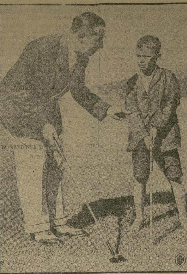
Walter Hagen, el famoso campeón de golf, está pasando una temporada en las tierras lejanas de Australia. No deja nunca de pensar en lo suyo y aparece en la fotografía enseñando a un pequeño australiano cómo dar los primeros pasos en el juego.