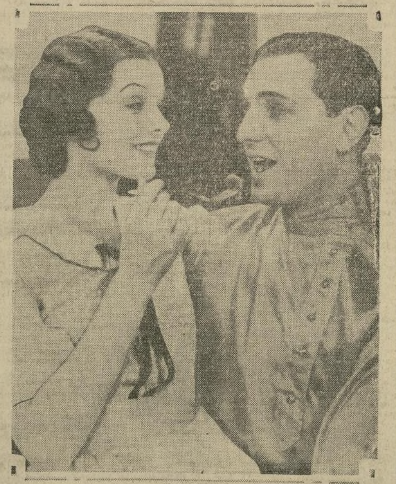
Joseph Schildkraut y Myrna Loy en una escena de "Cock O' the Walk", película hablada de cuyo argumento es el autor un joven escritor argentino y que se exhibe al presente en el "Roxy".

na a atacar con su acostumbrado vigor los varios asuntos relacionados con el teatro "Roxy". Su primera ocupación va a ser el arreglo del programa que rodeará las proyecciones de la última producción musical Gaynor-Fallers, "High Society Blues". El advenimiento de la Pascua y la primavera será la clave de las festividades teatrales.