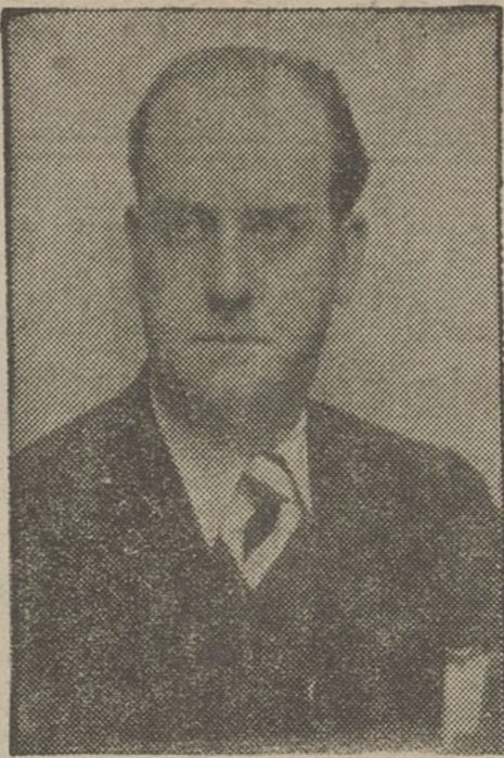
José Tomás i Piera, el nou ministre de Treball del Govern Largo Caballero.

Sobriament, sense paraules inútils—no és hora de paraules—destaquem als ulls de l'opinió pública del nostre poble, la cada dia més forta personalitat de Tomás i Piera, que va a representar l'Esquerra Catalana en aquest nou Govern que enquadra les forces proletàries, republicanes i nacionalistes de «Front Popular».