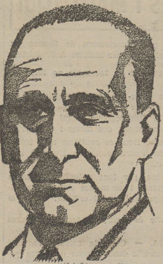
FRANCESC LARGO CABALLERO

—Ara, a la Unió General de Treballadors—ha contestat el senyor Largo Caballero.